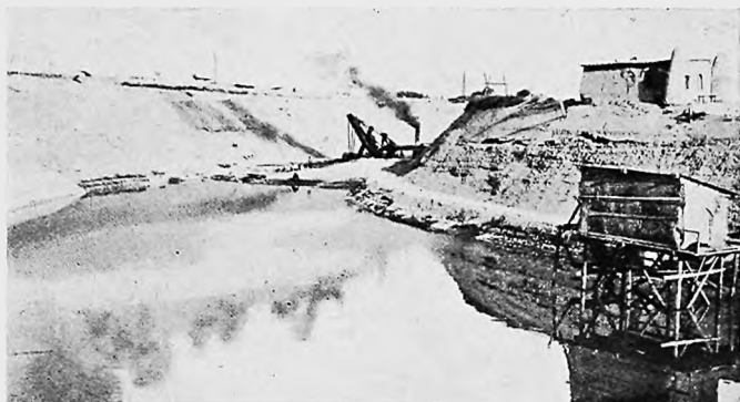
Постройка новаго канала. Вдали—экскаваторъ.

Вдоль новаго канала,—такъ сказать вверхъ по теченію,—то въ виду его готоваго русла, то сравнительно далеко отъ него, мчимся мы вновь по равнинѣ. Минуемъ селеніе Никольское, и затѣмъ направляемся непосредственно къ югу, къ головнымъ сооруженіямъ каналовъ.