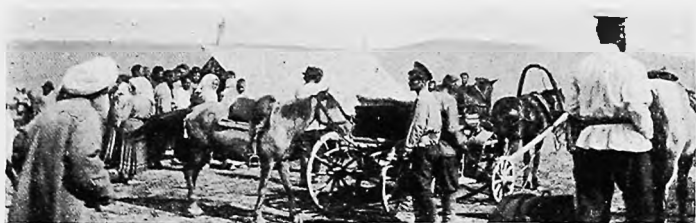
Смѣсь лицъ, нарѣчій, костюмовъ.

особенно если она «закрыта» временно для переселения. Крестьянинъ идетъ, ищетъ свободной земли, — нигдѣ не находитъ. Куда преклонить ему голову, да еще на чужой сторонѣ? А тутъ вдругъ православный поселокъ. Примите, ради Христа! Изволь, но за хорошія деньги (100—300 р.)... А не можетъ платить—и живетъ батракомъ, либо арендуетъ у кого нибудь землю, или, наконецъ, съ отчаянія пашетъ очевидно чужую,—авось сойдетъ какъ нибудь. И бываетъ, что «сходить», вообще же многія села дѣлаютъ себѣ такимъ образомъ изъ допринятія новыхъ прибывшихъ значительный источникъ дохода, въ ущербъ, конечно, общей земельной обезпеченности. Такъ и въ Ивановскомъ: