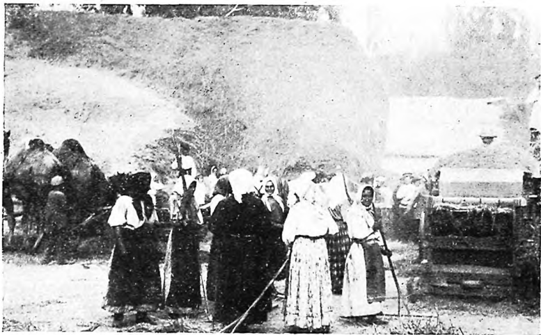
Молотьба у зажиточнаго переселенца въ Ивановскомъ.

теперь только выяснилось, что, непривычные къ экономическому обращенію съ водою, сами же крестьяне Михайловскаго едва себя не показали серьезно... А именно,—установивъ самовольно на отводѣ отъ одного родника три водоналивныя мельницы, и вообще крайне неряшливо обращаясь съ гидротехническими сооруженіями, что и вызвало, сверхъ всего, загрязненіе головныхъ родниковъ.