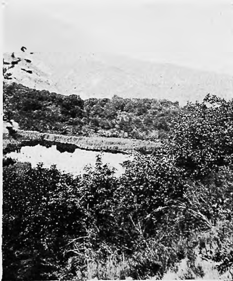
Лѣсное горное озеро близъ Арысланбоба.

Кишлакъ Арысланбобъ расположенъ на высокомъ бугрѣ, какъ на островѣ среди широкой долины. Пирамидальные тополя, грецкій орѣхъ, кленъ и вязы густо заполняютъ кишлакъ, и дѣйствительно мѣсто здѣсь чудное. Именно здѣсь изъ потока, непосредственно съ горъ, образуется прекрасная рѣчка, возлѣ которой мы поднима-