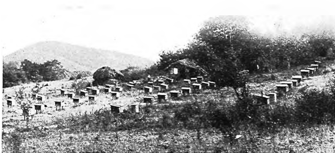
Пасѣки крестьянъ въ Алексѣевскомъ.

Панорама отъ этого дерева—старога грецкаго орѣха—открывается дѣйствительно дивная. На вѣскольکو верстъ впереди спускается пологими изумрудными скатами та гора, на вершинѣ которой мы стали, а едва ли не весь небосклонъ занимаютъ на сѣверѣ могучіе снѣговые хребты,