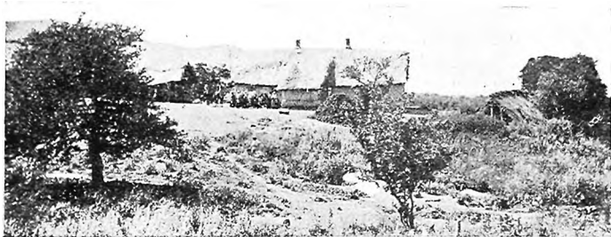
Одинъ изъ хуторовъ Алексѣевскаго.

такъ какъ кругомъ богатая зелень, посѣвы. Послѣдніе принадлежатъ здѣсь частью осѣвшимъ или теперь осѣдающимъ подъ вліяніемъ примѣра переселенцевъ киргизамъ, юрты которыхъ среди огородовъ производятъ впечатлѣніе странное, а частью, уже нѣсколько выше—русскому селенію Балканскому.