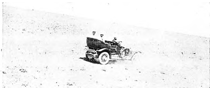
Голодная степь натуральная.

Церковь, школа, больница. Странно и трогательно прежде всего видѣть здѣсь, въ самомъ центрѣ издавна магометанскаго края, ослѣпительно сверкающій золотомъ крестъ, высоко уходящій въ ярко синее небо. Каменный храмъ въ память святителя Алексія сооруженъ только въ