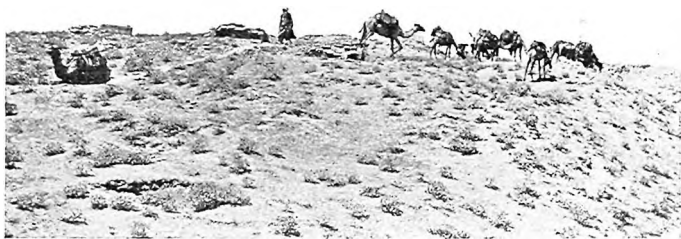
На поляхъ „старого“ Туркестана.

Ташкентъ подробно описывался неоднократно, и поэтому я ограничусь общимъ утвержденіемъ, что и въ іюль здѣсь можно жить не безъ пріятности. Жара умѣряется тѣнью, водою, искусственнымъ льдомъ, а безъ жгучаго солнца развѣ можетъ быть стильна вся эта старая Азія, упорно цѣпляющаяся за право на современную жизнь въ старомъ, туземномъ Ташкентѣ?