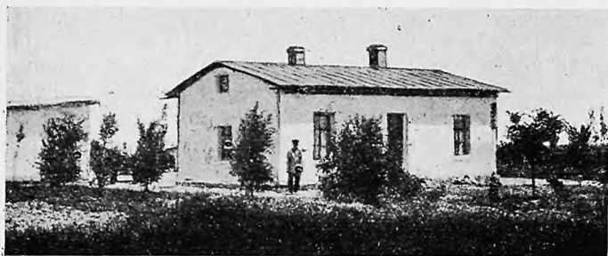
Голодная Степь орошенная (Спаское).

Окончательно провѣренныя результаты дѣятельности этого поля за тринадцать лѣтъ его существованія уже сведены къ тому, что опредѣлены наилучшіе сроки посѣва и необходимое количество поливовъ хлопчатника, выяснена необходимость опредѣленныхъ удобреній, установлены рациональнѣйшіе сѣвообороты, доказана необходимость нѣкоторыхъ машинъ, введенныхъ уже переселенцами, установленъ нормальный расходъ воды на десятину, испытаны разные сорта хлопка и выяснены наи-