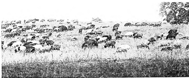
Стадо овецъ переселенца крестьянина.

Эта этнографическая пестрота населенія, бросающаяся въ глаза даже теперь, послѣ десятка лѣтъ совмѣстнаго жительства, на первыхъ порахъ какъ пришлось тутъ же выяснить—вызываетъ извѣстныя тренія; но, основанныя обычно на разныхъ мѣстныхъ привычкахъ къ хозяйствованію, эти тренія здѣсь даже не бесполезны: подъ влияніемъ одинаково для всѣхъ новыхъ условій, разность навыковъ мало по малу сглаживается, и благодаря именно разностороннему коллективному опыту скорѣе достигается усовершенствованіе мѣстной культуры, а съ тѣмъ вмѣстѣ и благосостояніе засельщиковъ.