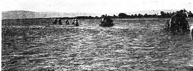
Переправа черезъ Кара-Дарью.