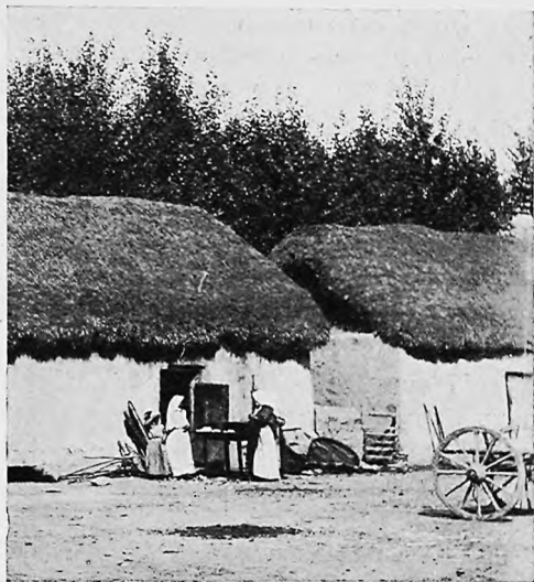
Во дворѣ переселенца въ Михайловскомъ.

примыкают постройки самовольцевъ, недавно еще поселившихся на новомъ переселенческомъ участкѣ «Любино», причемъ обращенный фронтъ къ горамъ усадьбы тянутся одной непрерывною линіей на протяженіи до четырехъ верстъ. Этотъ поселокъ, заключающій въ себѣ 114 крестьянскихъ дворовъ, орошается и обезпечивается въ питьевомъ отношеніи восемью родниками, а почва, климатъ и рельефъ участка тождественны съ таковыми же поселка Михайловскаго и вообще Кугартской долины.