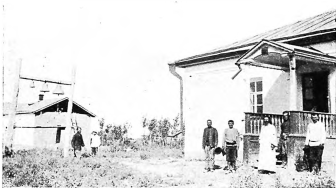
Молитвенный домъ въ поселкѣ Ивановскомъ.

сбюют и продать его можно здѣсь дорого. Правда, такое положеніе вещей нельзя признать совершенно нормальнымъ, такъ какъ слѣдствіемъ подобной аренды естественно можетъ явиться привычка связывать увеличеніе доходности хозяйства съ распространеніемъ его на поверхности, а не съ улучшеніемъ качества,—по особой бѣды въ этомъ, кажется, нѣтъ, такъ какъ аренда на примѣръ сѣнокосной земли свидѣтельствуетъ о промышленно-скотоводческой предпримчивости переселенцевъ,—обладающихъ уже даже нынѣ хорошими по качеству овцами... При этомъ,