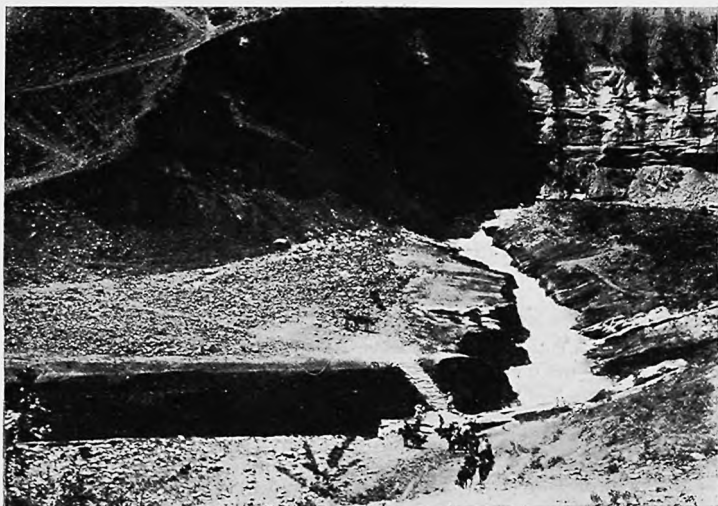
Переправа черезъ Кугартскую щель—къ селенію Солдатскому.

на который въ обычныхъ условіяхъ не ступилъ бы и одною ногою. Теперь же, въ предчувствіи новыхъ мученій подъема, рѣшительно отвергаю предложеніе проводника сойти съ лошади—«не ровень часъ—мостъ не удержитъ», и ѣду верхомъ черезъ жерди, положенныя безъ всякихъ подпоръ и танцующія въ это время какой то отчаянный танецъ. Впечатлѣнія почти никакого!