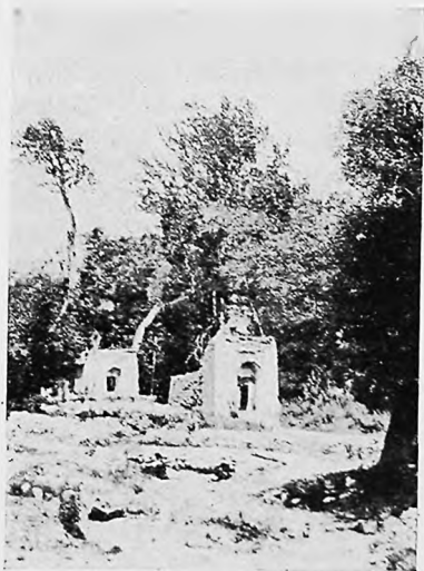
Могила праведника Арысланбоба.

И не одни только сарты. Ближе къ кишлаку Арысланбобу, и по мѣрѣ расширения долины, здѣсь и тамъ видны бѣлые домики—фермы, среди натуральныхъ садовъ.