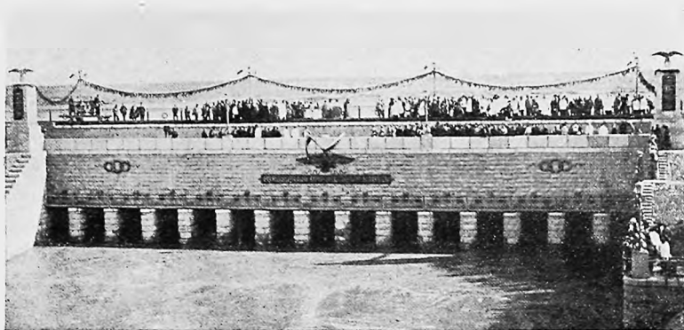
Новый каналъ—Романовскій—передъ открытіемъ.

Жизнь бьетъ ключемъ на постройкѣ, энергіи у строителей много, и не хватаетъ одного лишь—здоровья. Пребываніе въ теченіе нѣкоторыхъ лѣтъ близъ воды, въ банной почти атмосферѣ, при обиліи гнѣющихъ камышей и гнѣздящихся въ нихъ комаровъ, заболѣваніе маляріей почти обязательно, и вотъ почему въ лицахъ новыхъ знакомыхъ я вижу и излишнюю блѣдность, и лихорадочный блескъ иныхъ глазъ... Однако, какъ теперь выясняется, нездоровая