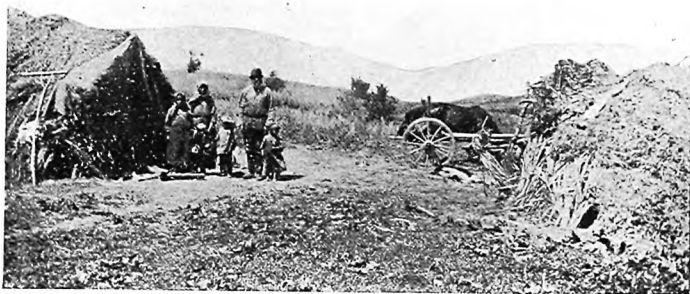
„Самоволецъ“ на Алексѣевскомъ.

одного камешка, ни одного крутого обрыва, все холмы и холмы, правда огромные, но въ общемъ не всегда даже и замѣтень подъемъ. Но вотъ, съ какой нибудь точки случайно откроется видъ хотя бы на ту же Кугартскую низменность, затянутую пеленою тумана, на еле видныя по-тустороннія, южныя, горы, гдѣ также теперь живутъ русскіе—и поймешь тогда, что взобрались высоко.