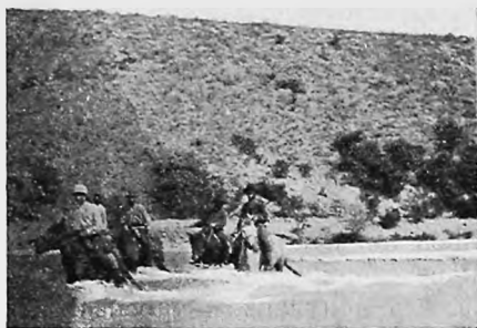
Переправа черезъ Кара-Унгурь.

тогда какъ чисто богарные посѣвы, расположенные по окраинамъ впадины, легко даютъ 130—150 пудовъ пшеницы на десятину. Оставалось принимать эти и другія опытные данныя къ свѣдѣнію, и теперь весь участокъ уже размежеванъ на 80 хуторовъ по 40 десятинъ богарной земли каждый, причемъ нечего и говорить,