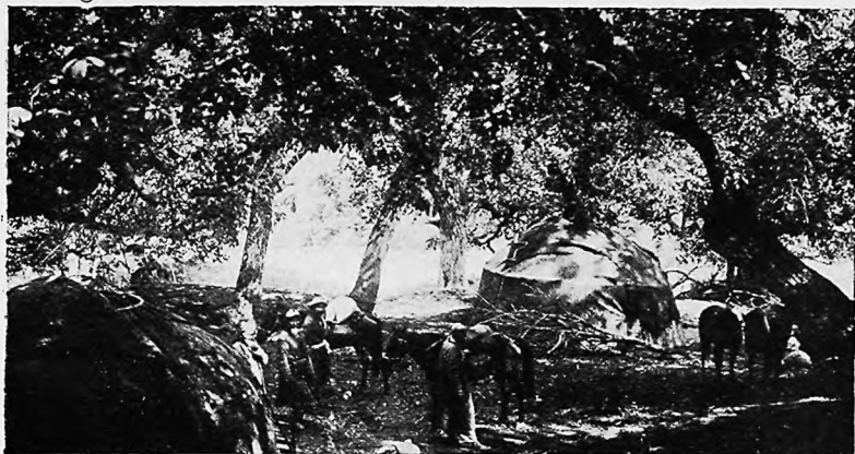
Въ лѣсу-саду близъ Благодатнаго.

Здѣсь, на высотѣ до 7 тысячъ футовъ, и пока безъ колесной дороги, изъявили желаніе селиться 10 семействъ самыхъ обыкновенныхъ крестьянъ малороссовъ, нашедшихъ что «лучше не надобно». Дѣйствительно: по 70 десятинахъ