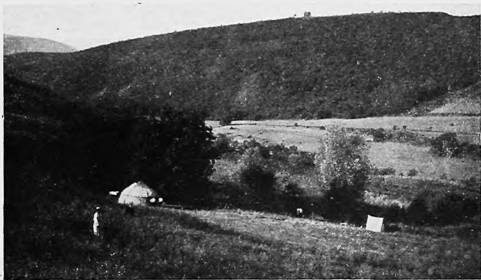
Гидротехническая ставка „въ раю“.

чемъ результатомъ ревизіи было то, что уже блаженствовавшему въ Чарвакѣ раеискателю припилось вновь направиться на поиски дальше. На сей разъ и овъ не замедлилъ. Пройдя нѣсколько верстъ вверхъ по горной рѣчкѣ, праведникъ остановился, и возгласилъ уже окончательно, что здѣсь—лучшее мѣсто на свѣтѣ. Аллахъ этотъ выборъ одобрилъ и съ той поры Арысланбобская дача, считается мѣстомъ бывшаго рая.