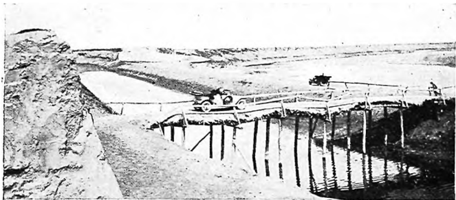
Одинъ изъ контрастовъ въ Голодной Степи.

имѣются естественные луга и тугаи, представляющіе собою превосходный выпасъ для скота и частью используемые даже для посѣвовъ безъ искусственнаго орошенія. Въ исключительно благоприятныя условія поставлены, наконецъ, эти поселки въ отношеніи заработковъ, благодаря непрекращающимся работамъ по сооруженію ирригаціонныхъ каналовъ, а также сбыта продуктовъ, въ особенности продуктовъ животноводства»... *