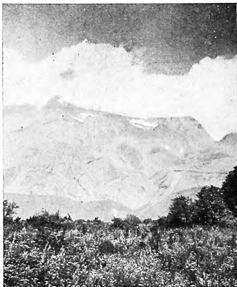
Надѣлы переселенцевъ Воздвиженскаго.

чему во вновь устроенныхъ русскихъ поселкахъ вездѣ разные размѣры надѣловъ на дворъ при казалось бы, равныхъ условіяхъ. — Соответственно качественному сочетанію угодій въ предѣлахъ cadastra участка. Такъ напримѣръ, почти вездѣ требуется для усадебъ и огородовъ земля поливная; ея достаточно десятины на дворъ, но мы будемъ наблюдать даже случаи, когда вслѣдствіе недостатка па-