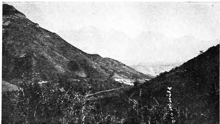
Одинъ изъ видовъ отъ Воздвиженскаго.