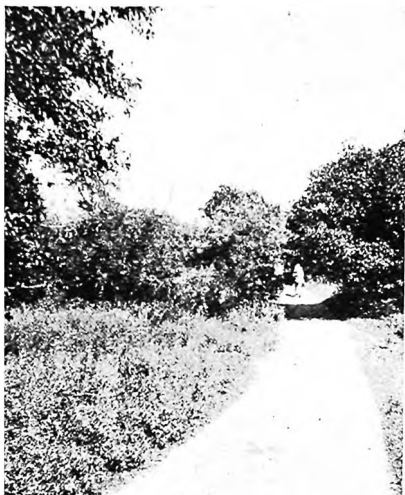
Дорога-аллея отъ Чаргакъ къ Арысланбобу.