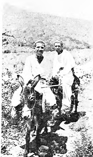
На востокъ отъ Андижана.

Главное современное достоинство Андижана заклю-