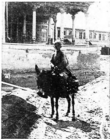
Въ „старомъ“ Ташкентѣ.

Чуть свѣтъ на слѣдующій день мы уже въ предѣлахъ Туркестанскаго края—въ наиболѣе сѣверной его части въ Сыръ-Дарьинской области. Голубою полоскою мелькнуло Аральское море, съ промышленнымъ и ловецкимъ поселкомъ Аральскомъ, заложеннымъ здѣсь нашими переселенцами сразу же по проведеніи желѣзной дороги, а теперь развн-