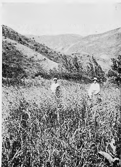
Въ предгорьяхъ близъ поселка Балканскаго.

Ко времени устройства «по формѣ» этихъ дѣйствительно піонеровъ культуры, переселенческой организаціи оставалось лишь констатировать фактъ, что здѣсь безъ орошенія искусственно растеть, напримѣръ, даже просо, что родвики тутъ великолѣпнаго качества, и что нужно лишь построить колодцы. Къ этому уже и приступлено, получившимъ же надѣлы крестьянамъ — числомъ 77 — отве-