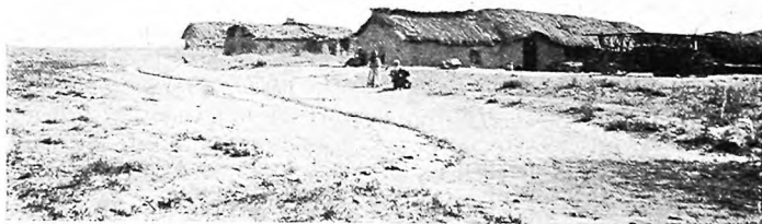
Кугартскій поселокъ Дмитріевскій.