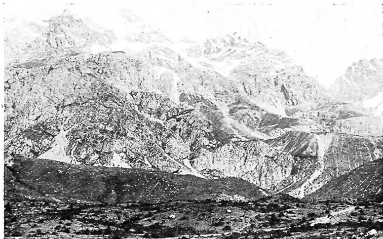
Выголь участка Благодатнаго.

На самой вершинѣ участка Благодатнаго, этого послѣдняго передъ снѣгами «мягкаго» лѣсного бугра, нѣтъ, при всей влажности климата, никакой естественной рѣчки, и переселенцы рѣпили спуститься съ постройками ниже, къ рѣкѣ, что течетъ къ кишлаку Арысланбобу, оставивъ на верху—«ближе къ Богу»,—какъ не могъ не пошутить сивоусый переселенецъ полтавецъ—свои полевые участки.