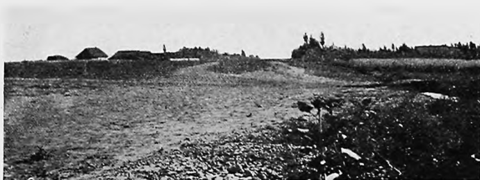
Общій видъ селенія Ивановскаго.