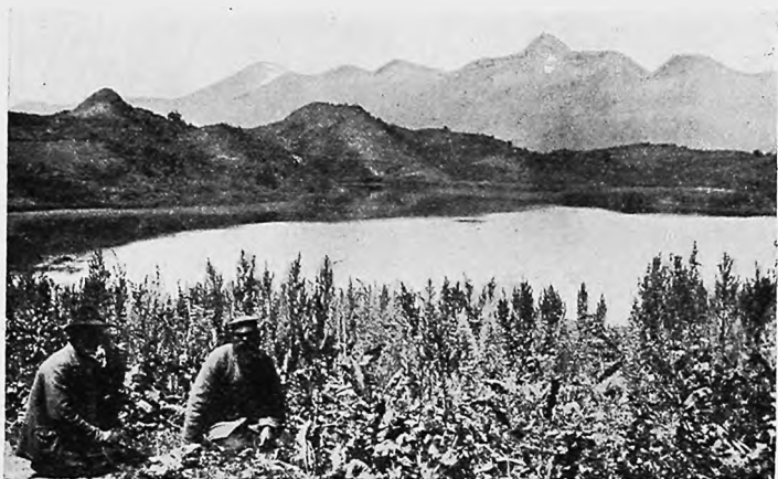
Урочище Кара-Куль—Черное Озеро—теперь Алексѣевское.

Къ удивленію, вторичное испытаніе не произвело уже на меня столь потрясающаго впечатлѣнія, какъ первое.—очевидно все дѣло въ привычкѣ.