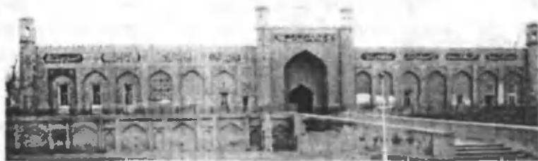
Қўқон хонлиги ўрдасини ҳозирги кўриниши.

Умуман олганда Қўқон хонлигига барҳам берилиши, Бухоро ва Хиванинг тобеъ давлатлар сифатида сақлаб уларга нисбатан мустамлакачилик сиёсатини олиб борган чор маъмурияти кейинчалик бу ерда чор шовинизми, руслаштириш, Россия ички ҳудудларидан аҳолини кўчириб олиб келишни амалда жорий этди. Чор Россиясининг мустамлакачилик сиёсати тўлиқ маънода Ўрта Осиёнинг бошқа давлатларига нисбатан Қўқон хонлигида амалга оширилди.