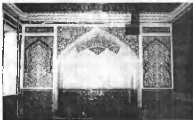
Қўқон хонлиги ўрдасининг ички кўриниши

- Ва ниҳоят, бугунги кунларда Ўзбекистон раҳбарияти миллат ва давлат манфаатларидан келиб чиққан ҳолда халқаро майдонда элчилик сиёсатини олиб бораётганини уқтириш.