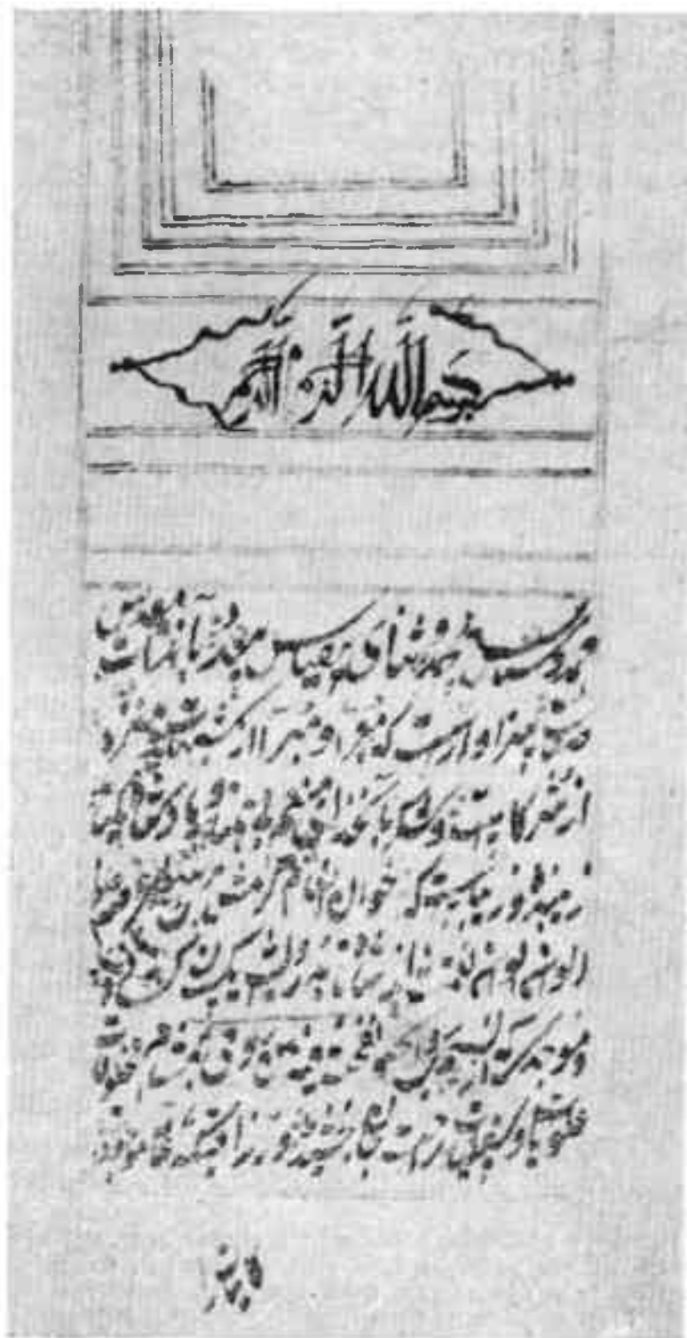
«Тарихи жадидаи Тошканд» асари қўлэзмасининг биричи саҳифася. Муаллиф дастхати.