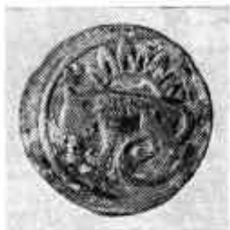
Ўзбекистон ССР территориясидан топилган тангалар

XIII асрга оид Хоразмнинг биринчи дирҳамларида