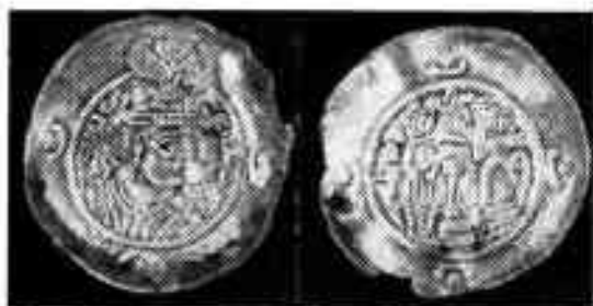
Ўзбекистон ССР территориясидан топилган тангалар

Бухоро областида Урта Осиёга кўплаб кириб келган Сосонийлар кумуш тангаси таъсирли роль уйнаган. Бухорода V асрга келиб бухорхудотлар дирҳами деб аталган танга зарб этила бошланган. Танганинг бир