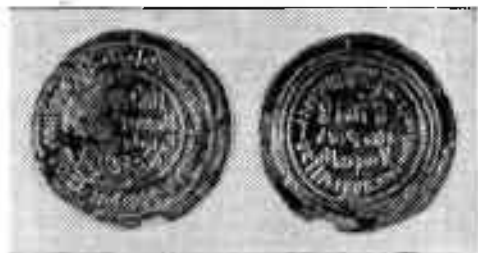
Ўзбекистон ССР территориясидан топилган тангалар

Сомонийлар томонидан зарб қилинган тангалардаги ёзувлар худди халифалик даврида зарб қилинган тангалардек эди. Тўғри, мис ёки кумуш тангаларнинг бир томонида бир ёки икки қатор, аҳён-аҳёнда эса уч қатор ёзувлар учрайди. Дирҳамларда фақат Сомонийлар ноибининг исми ёзилибгина қолмай (гарчанд улар