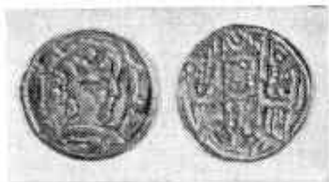
Ўзбекистон ССР территориясидан топилган тангалар

ри — Нух, Аҳмад ва Яҳё халифа Мамунга курсатган хизматлари учун Мовароуннаҳрнинг турли областларига ҳоким этиб тайинланадилар. Табиийки, халифаликнинг чекка ўлкаларига жойлашган Сомонийлар мустақилликка эришишга ҳаракат қилганлар. Улар Тоҳирийлар сулоласи тахтдан туширилгандан кейингина мустақилликка эга бўлганлар. Улар Сомонхудоётнинг чевараси Исмоил ибн Аҳмад ҳукмронлик қилган вақтда мустақилликка эришдилар. Исмоил ибн Аҳмад қисқа муд-