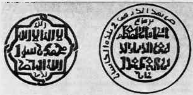
Ўзбекистон ССР территориясидан топилган тангалар

Бундай аҳвол узоққа чўзилиши мумкин эмасди. Савдо-сотив ишлари мўғуллар босиб олган вақтдаги дара-