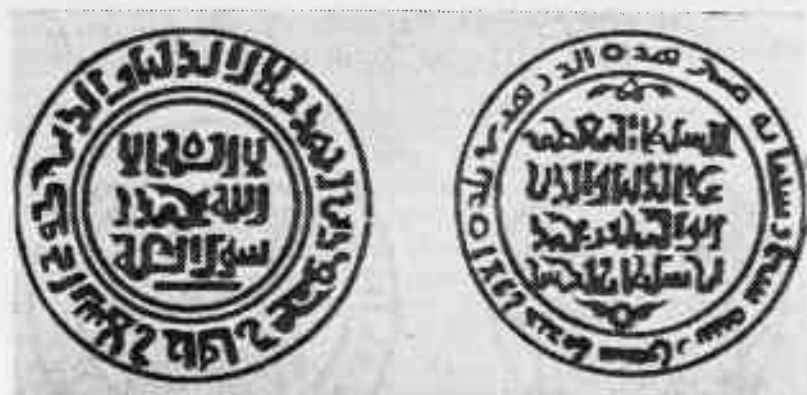
Ўзбекистон ССР территориясидан топилган тангалар

1225 йили Самарқандда зарб қилинган дирҳамлар диққатга сазовордир. Муғуллар истилосидан кейин ордан беш йил ўтган бўлса ҳам дирҳамларнинг тури жуда ўзига хосдир. Биринчидан, ҳеч қаерда диний ақи-