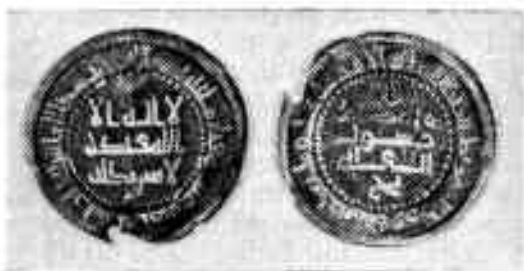
Ўзбекистон ССР территориясидан топилган тангалар

Сомонийлар даврида зарб қилинган мис тангалар ташқи кўриниши билан ҳам диққатга сазовордир. Мис танга энг кўп тарқалган, кўп муомалада бўладиган