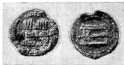
Ўзбекистон ССР территориясидан топилган тангалар

Олтин тангаларга нисбатан аъло сифатли кумушдан кўплаб зарб қилинган тангалар мамлакат ташқари-