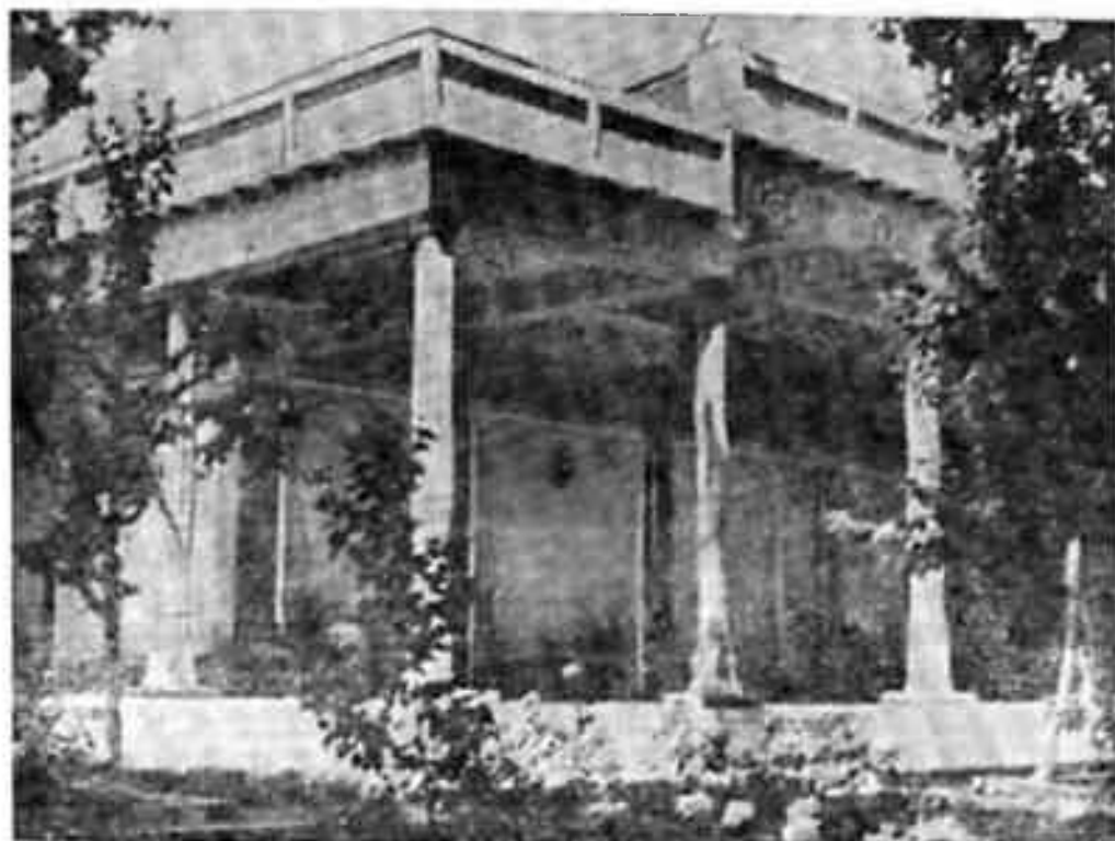
Намангандаги тарихий обидалардан бири.