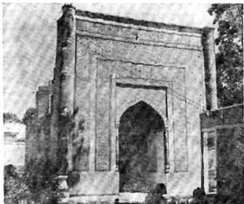
Хўжа амин мақбараси (XVIII аср).

Короскон қишлоғидаги Султон Сайид мазорининг шайхлари номига Бухоро амирлари ва Қўқон ҳукмдорлари томонидан XVI—XIX асрларда берилган вақф ҳужжатларида — ёрлиқларда Наманган номи мавзе (қишлоқ) сифатида 1643 йилдан бошлаб тилга олинди 25 .