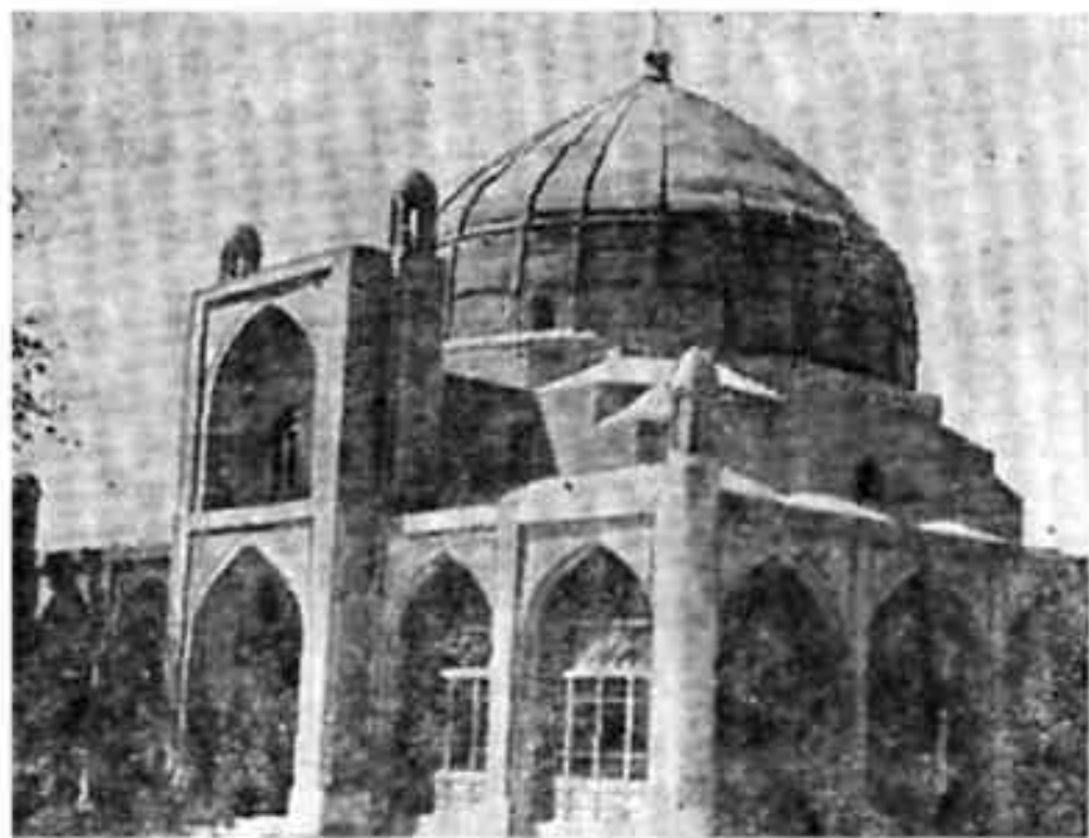
Ота Валихонтура мақбараси (XX аср).

нузгача мамлакатимизнинг турли музейларини безаб турибди. Чунончи, Наманган ўлкашунослик музейида, ҳатто Нью-Йорк музейида сақланаётган бринчдан ишланган сиёҳдонларнинг нақши афсонавий воқеаларни тасвирлаши билан ажралиб туради. Бундай мисоллар айрим тарихчиларнинг Фарғона аҳолиси металл ишлашни хитойликлардан ўрганганлар 29 , деган тахминларига тузатиш киритишга имкон беради. Аксинча, кейинги тадқиқотларнинг кўрсатишича, хитойликлар бринчдан буюм ясашни (рихтагарлик) бизнинг халқимиздан ўрганганликлари эҳтимолдан холи эмас 30 .