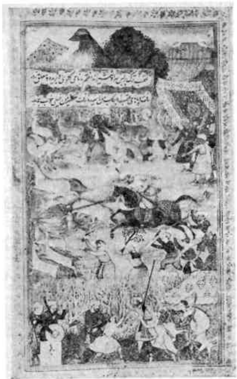
Облавная охота.— Миниатюры к «Бабур-наме». Ташкент, 1978.