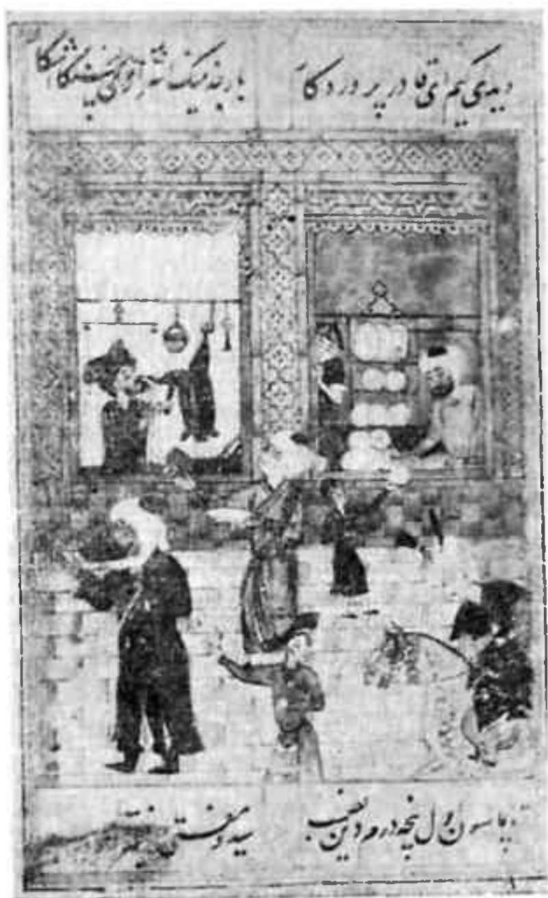
Торговые лавки — луканы. — Миниатюры к произведениям Алишера Навои. Ташкент, 1982.

сами продавали свои изделия, часть которых изготовлялась здесь же, в рыночных мастерских; другие передавали товар торговцам, занимавшимся скупкой и перепродажей.