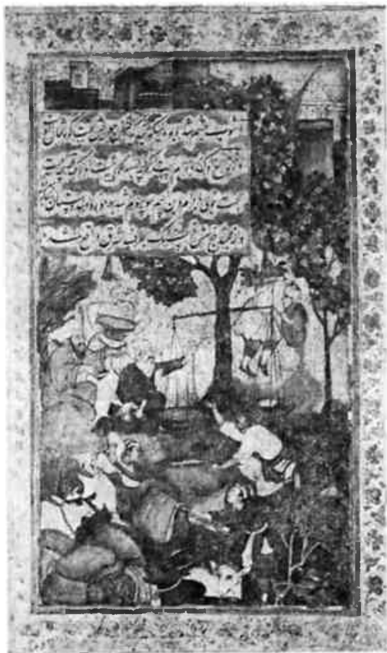
Сбор и вывоз миндаля.— Миниатюры к «Бабур-наме». Ташкент, 1978.