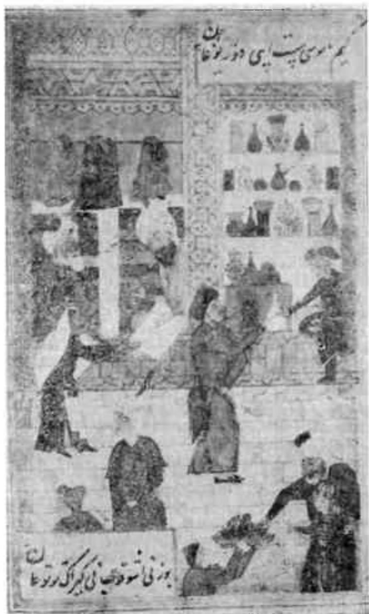
Торговые лавки — дуканы. — Миниатюры к произведениям Алишера Навои. Ташкент, 1982.