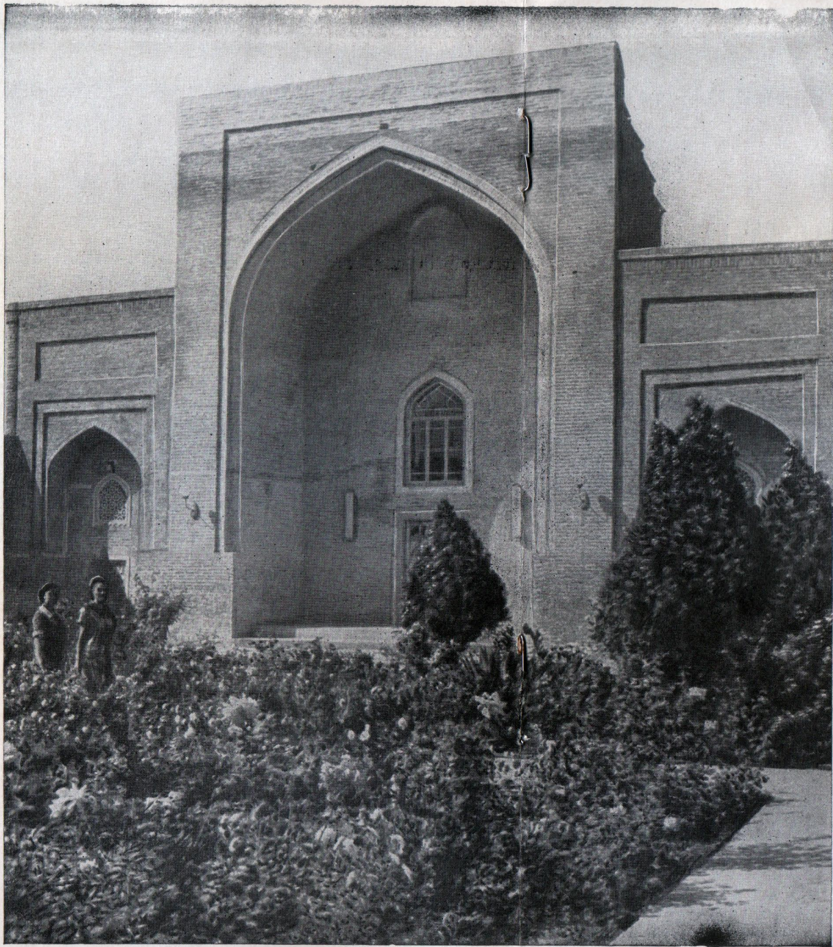
Бароқхон мадрасасининг ҳовлиси Медресе Барак-хана. Двор.