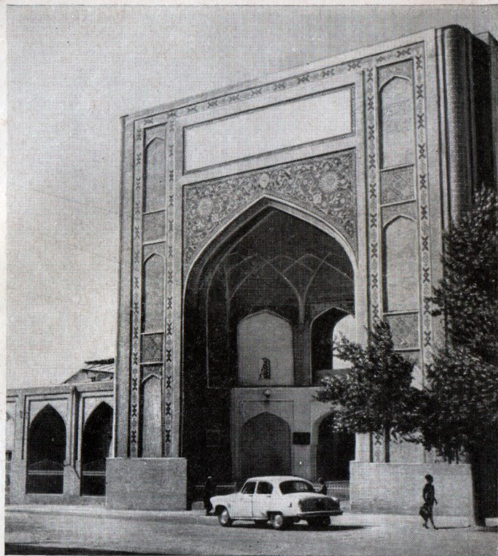
Бароқхон мадрасаси. Асосий пештоқ. Медресе Барак-хана. Главный портал.

Бароқхон мадрасаси 1859 йилда Тошкент ҳокими Қаноатшоҳ даврида кўп марта қилинган ремонтлар вақтида анча ўзгариб кетган. Унинг дастлабки кўриниши бузилган. XVIII—XIX асрлар мобайнида Бароқхон мадрасасининг қимматли ўймакор, садаф қадалган эшиклари, мақбара ичидаги агальматолиб устунлари, ўймакор безаклари ва ҳоказолар йўқолиб кетган. 1868 йилгача олинган суратлари, кошин ва безакларнинг 1935—1956 йилларда таъмир қилиш ишлари ўтказилаётган вақтда очилган ва тупроқ орасидан топилган қолдиқларигина мадраса фасадалари ва интерьерларининг қадимги кўринишини тўлароқ тасаввур қилиш имконини беради.