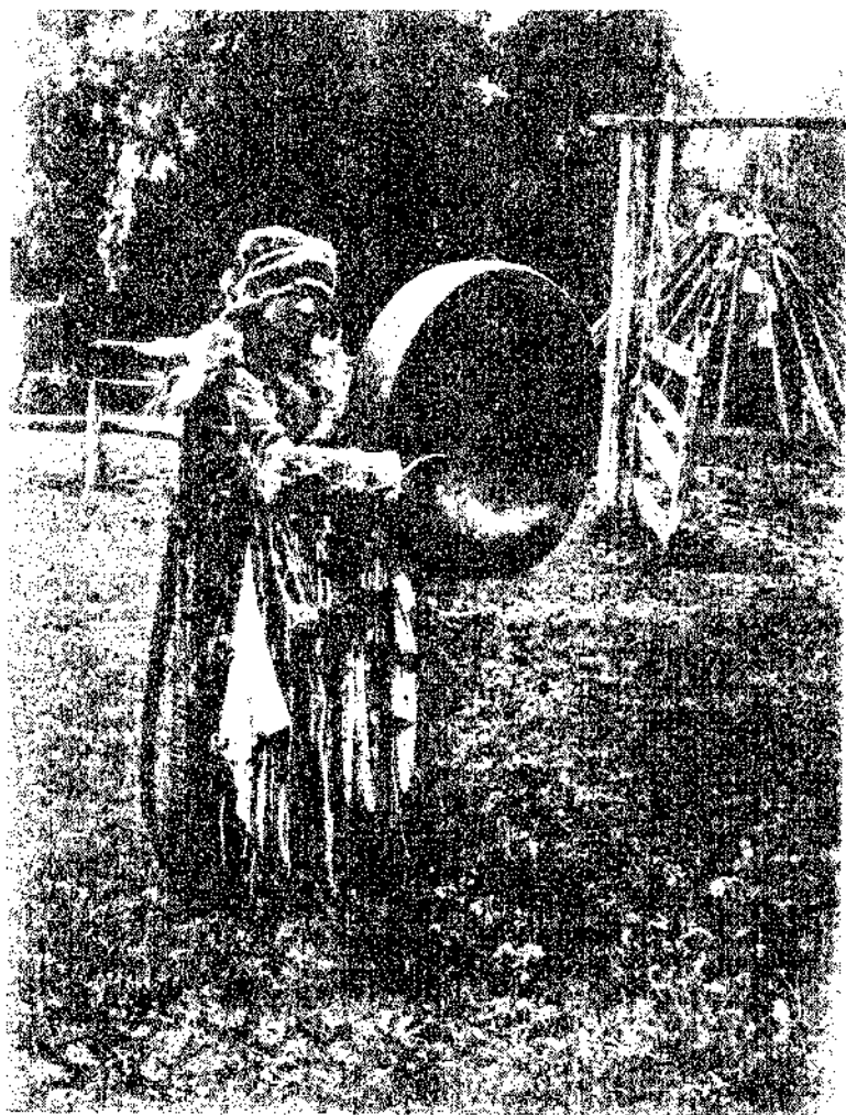
Рис. 5. Шамбака в маньяке.