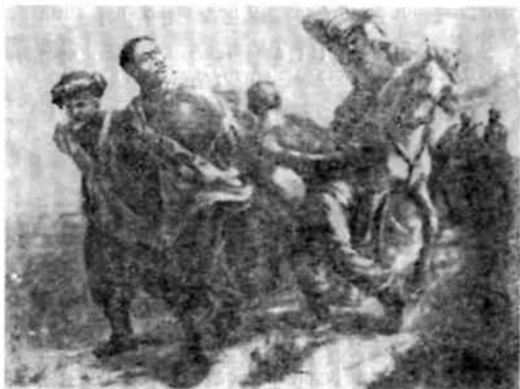
Восстание 1916 г. В тюрьму. С картины худ. Бортникова .

Уроки восстания 1916 г. не пропали даром. В период Великой Октябрьской социалистической революции трудящиеся массы Ферганской области, используя опыт восстания 1916 г., свергли власть своих эксплуататоров и под руководством Коммунистической партии с помощью великого русского народа стали строить новую свободную, счастливую жизнь.