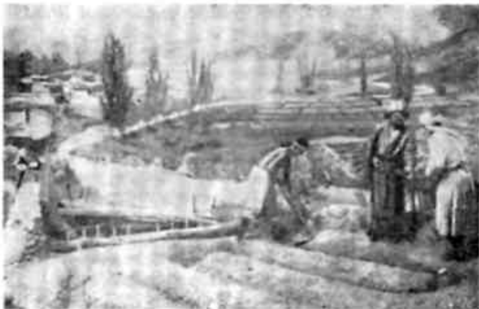
Бай и издольщики.

зовались сравнительно мало. Обычно сроковый наем рабочих производился с марта на два-три и более месяцев или же на весь период от вспашки до уборки урожая. Мардикер работал по 11—12 час. в сутки.