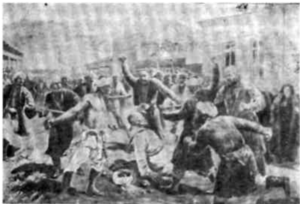
Восстание 1916 г. События в Маргелане. С картины худ. Гаврилова.

енное положение и образовать полевые суды для наказания „преступников“.