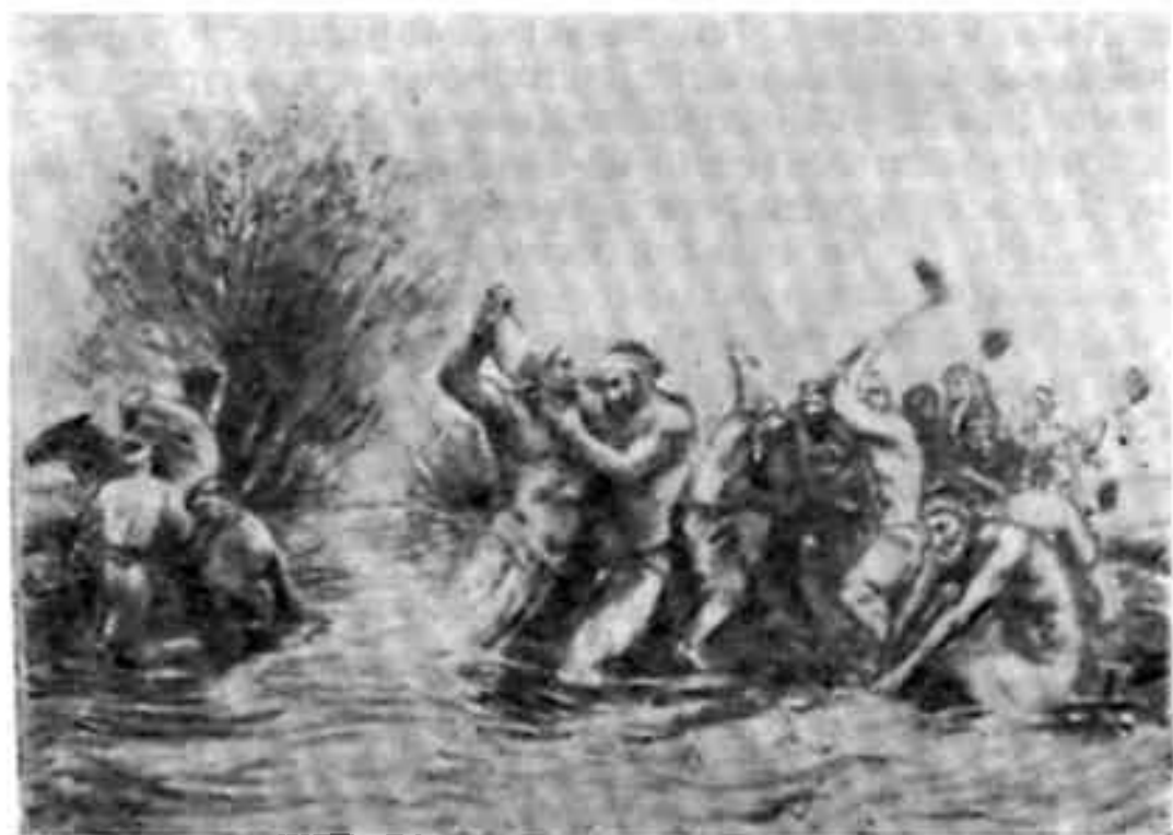
Так было при царизме. Столкновение из-за воды. Рис. худ. В. Рождественского

На виновных налагались денежные взыскания. Если ответчик не мог возместить тотчас нанесенный им ущерб, то совет старшин или вся община тут же вскладчину выплачивала штраф за виновного, но потом с него взимали в несколько раз больше, либо лишали права на водо- и землепользование 1 .