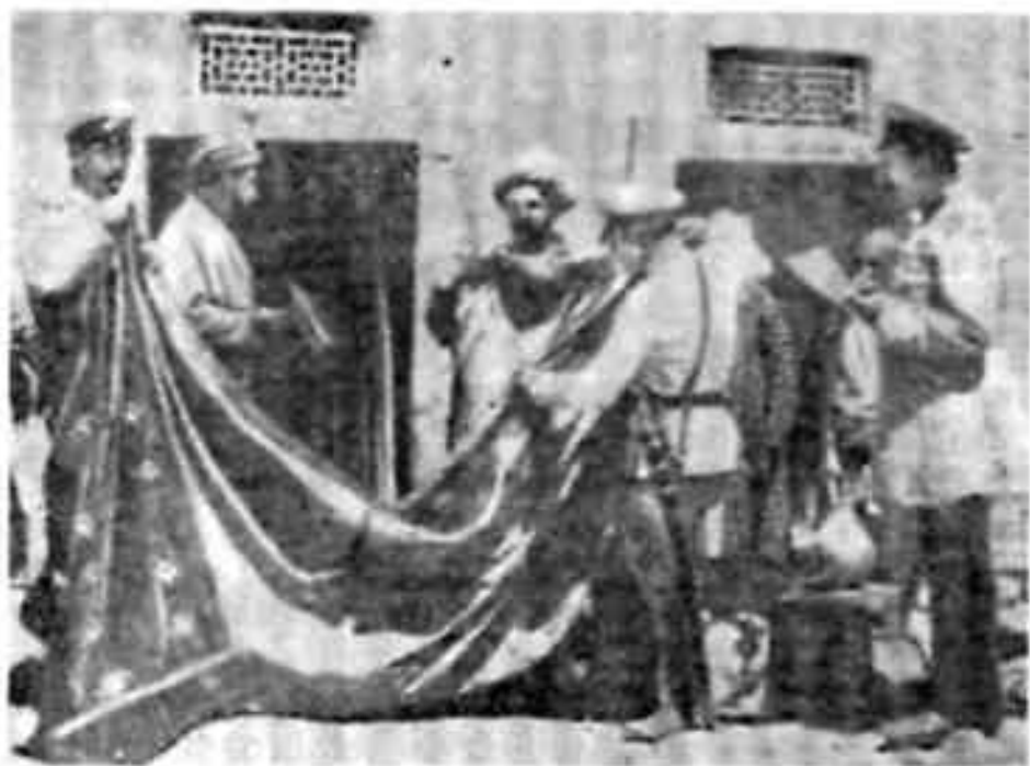
Разорение дехканства. Описание имущества недоимщика царской администрацией.

возрастающих затрат труда и денежных расходов со стороны дехканских хозяйств. С 1900 по 1904 г. расходы каждого хозяйства на выполнение дорожной повинности возросли по отдельным уездам на 5% (Анджанский уезд) — 110% (Маргеланский уезд). Основная тяжесть отбывания дорожной повинности опять-таки ложилась на плечи мелких дехканских хозяйств.