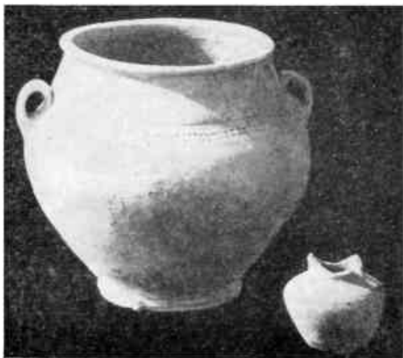
Горшок с яблоками X в. и кувшинчик

Каждая могила представляла собой глубокую купольную камеру — катакомбу, к которой от основания