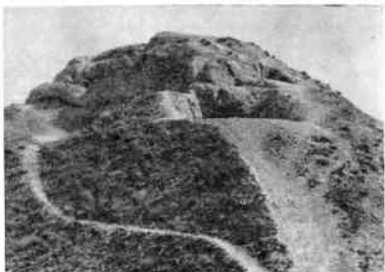
Типичные руины феодального замка

считались священными. Умерших, чтобы не осквернить этих стихий, нельзя было ни закапывать в землю, ни сжигать. Поэтому их выносили на специально сделанные постройки «башни молчания» или «дахмы», где хищные звери и птицы объедали труп. А кости, после того, как их обмыло дождем, обсушило солнцем и ветром, укладывали в ящички-оссуарии, которые хранились в погребальных камерах — наусах. Полтора тысячелетия тому назад