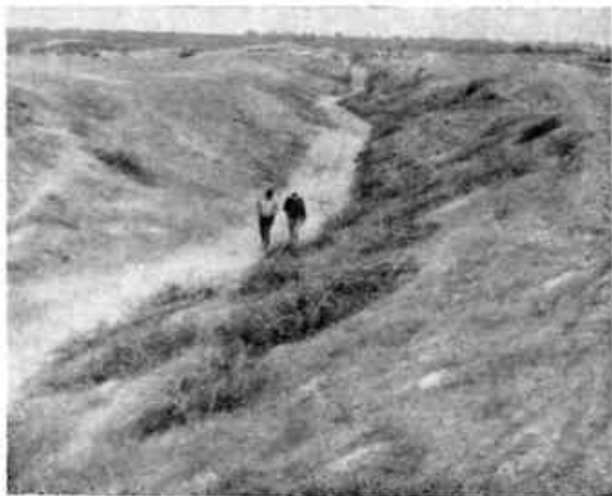
Улица древней Канки

циальными башнями в городских стенах, узкие пандусы подъемов со стороны рва. Три города примыкали к цитадели, стены которых на севере подходили к некогда полноводной реке. Сегодня безжизненно ее русло. Но наши разведки показали, что в древности на ней было