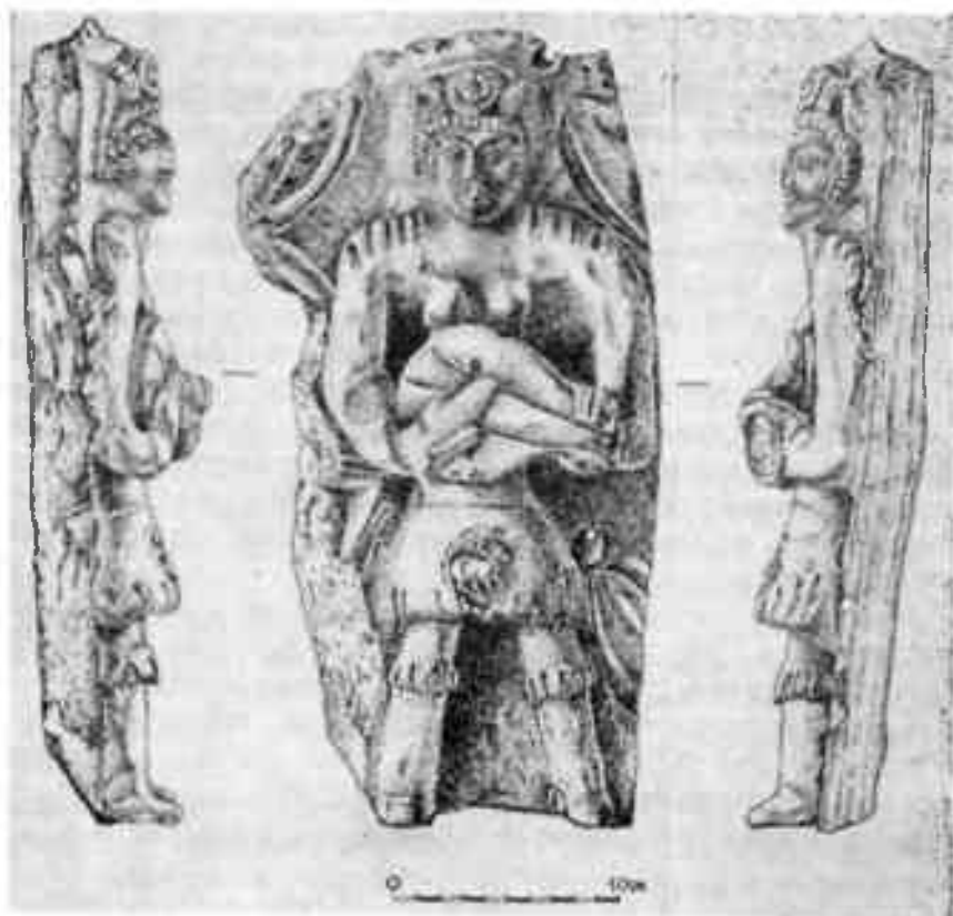
Скульптура музыкантши из Канки

Азии временем господства натурального обмена. Особенно глухой провинцией слыл Чач, стоявший на окраине земледельческих оазисов на границе с кочевой степью. Основываясь на отрывочных сообщениях восточных путешественников, ученые приписывали все торговые операции согдийско-самаркандским купцам. Даже ремесленно-торговые пункты в Чаче и на территории нынешней