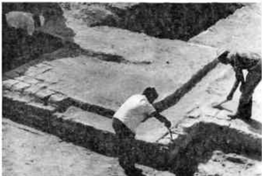
В центре стены суфа — эстрада

Фризы с изображениями фигур музыкантов украшали храмы Айртама около Термеза, Топраккалы. Здесь перед нами какие-то крупные залы типа храма, и скульптурка музыкантши лежала совсем не случайно. Рядом с залами удлиненные коридоры, подсобные и жилые комнаты.