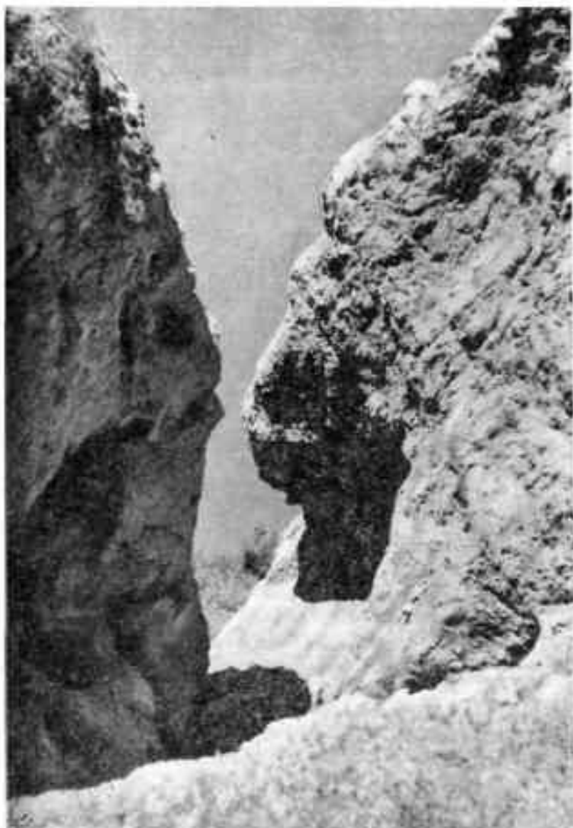
Каньон рва, окружающего Шахрухию

рухия лежит на руинах более древнего города, известного в восточных хрониках под названием Бенакет. По