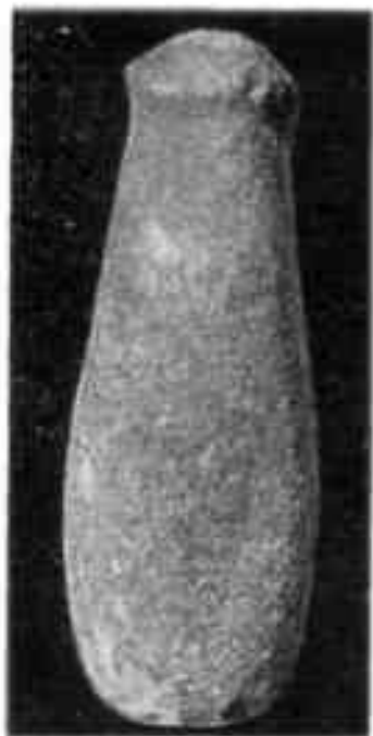
Пест для дробления руды

В VII—X вв. в пору феодализма вблизи рудника выросло громадное поселение рудокопов, протянувшееся вдоль сая на 300 м. На случай опасности его обнесли валом, внутри которого находился источник воды. На поселении найдено много обломков битой посуды: парадные глазурованные чаши, кухонные котлы и горшки, сосуды для хранения ртути. И, как всегда, интересны монеты IX—начала XI в. — 15 шт. (14 серебряных и медная): «черные дирхемы», которыми уплачивались налоги в казну, серебряные дирхемы, чеканенные в столичных городах —