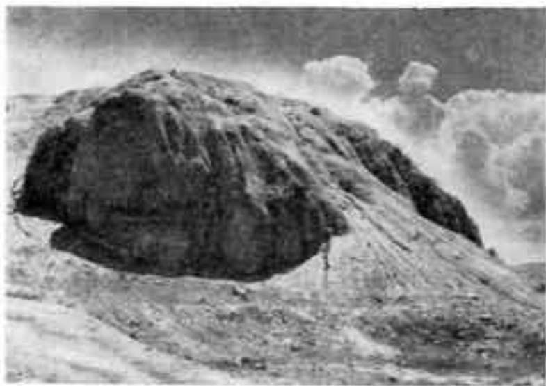
Руины цитадели древнего Паргуша

В пяти фарсах от Бинкета на этом пути стоял город Паргуш или Баркуш. Мы сейчас примерно на этом рас-