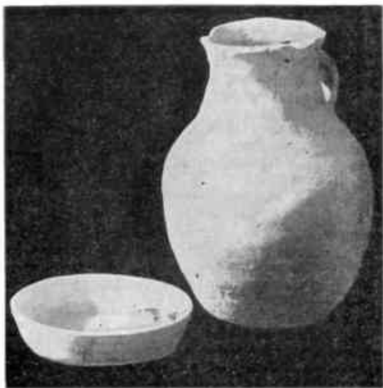
Сосуды из погребения близ Ангрена

Внутри — групповые захоронения. Причем при очередном захоронении первых погребенных просто отодвигали, чтобы уложить новую группу, так что костяки их рассыпались. Это навело археологов на мысль о том, что перед ними какие-то семейные усыпальницы. И хотя они