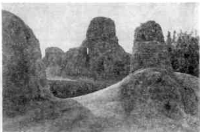
Башни Чиланзарского Актепа

Случайные находки позволяют открыть и погребальные памятники. На юго-западной окраине Ташкента в жилом массиве Чиланзар поднимаются невысокие холмики, известные под названием Красной горки. Однажды житель этого массива Ш. И. Радченко, выбирая глину для ремонта дома, наткнулся на метровой глубине на раз-