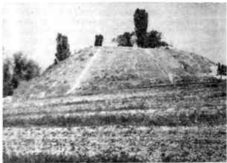
Холм древней крепости Чангтепа

При строительстве этого обелиска вместе с архитекторами на холм пришли археологи. Почти два месяца