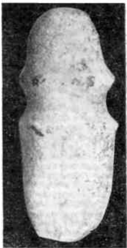
Молот древнего рудокопа

С помощью молотов крупные куски раскалывались, пустая порода отбрасывалась, а богатая рудой складывалась в кучи. Потом руда дробилась окончательно. Жернова приводились в движение силой проточной воды. Серебро-свинцовая руда дробилась до размера зерна или изюмины, из которых руду выплавить легче, чем из пыли, поэтому в жерновах для руды прорезано много крупных желобков.