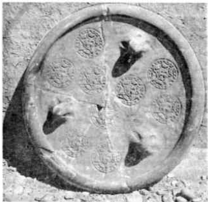
Керамический дастархан XI в. из Канки

большие раскопки в средневековом Ташкенте, на Канке, в Бенакете, в полной мере раскрывается искусство чачских мастеров. Вот только небольшая часть их из ремесленного квартала Харашкета: крупные почти полуметрового диаметра, но удивительно легкие открытые лаганы с резким профилем линий стенок и небольшие чаши с