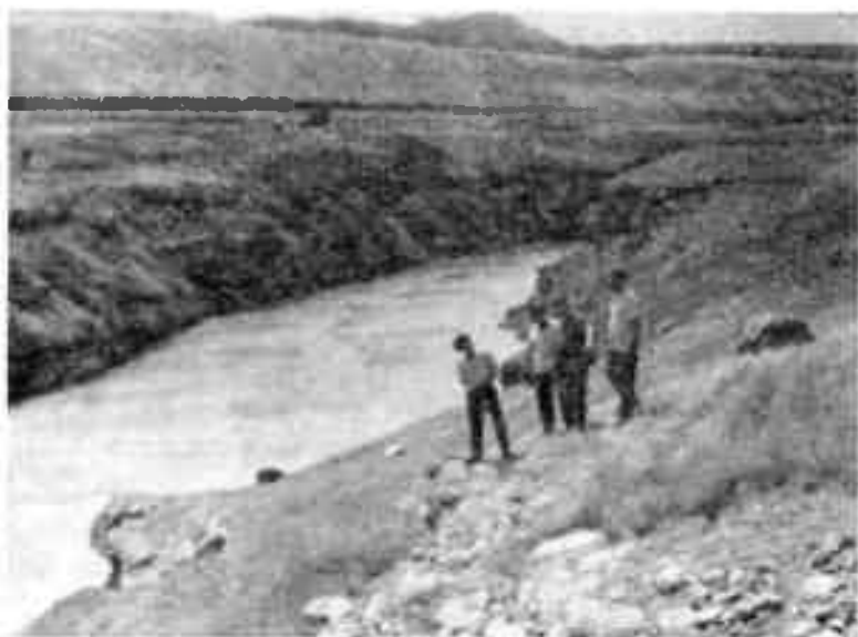
Река — естественная граница города

Долгое время считалось, что это только легенда. Но когда началось изучение района, у слияния Чаткала и Коксу были обнаружены руины города, расцвет жизни которого относился к IX—XII вв. Выяснилось, что вся