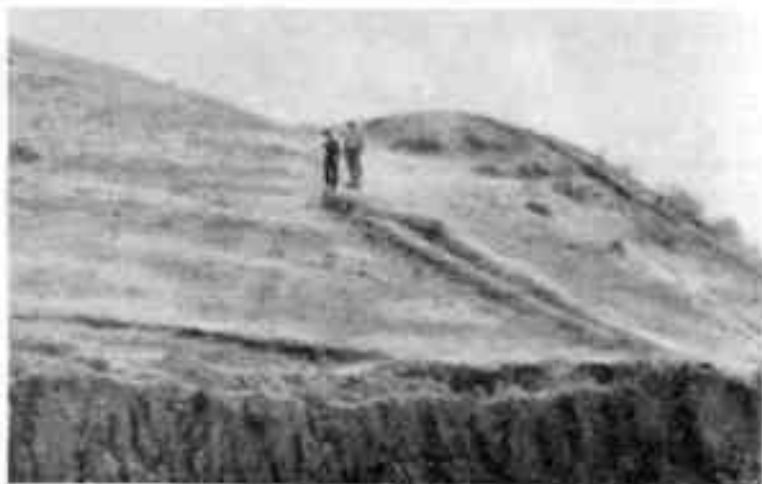
Археологи на городище Кавардан

Найдено немало интересных орудий труда и бытовых предметов. Железная соха и крупные ножницы для