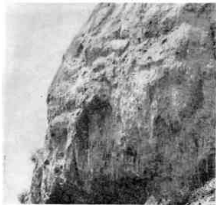
Могучие руины Искитепа

Обширная площадь внутри укреплений заполнена всхолмлениями кварталов жилых построек, мастерских