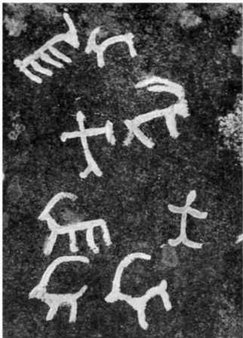
«Картильная галерея» на валунах