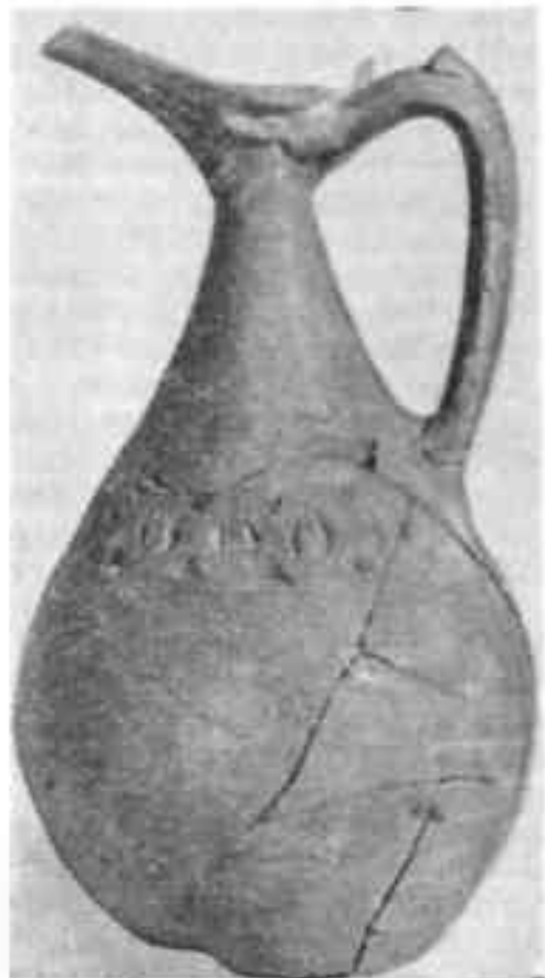
Гончарный кувшин VII в. из Канки

А рядом отвалы гончарного брака, обожженные керамические штыри. Они вставлялись в стены горнов, а на них подвешивались сосуды для обжига. И хотя печи пока не найдены, можно не сомневаться, что начато исследование хозяйства керамиста Харашкета. А открыть его, познакомиться с прекрасной ремесленной продукцией чачских мастеров для нас не просто интересно.