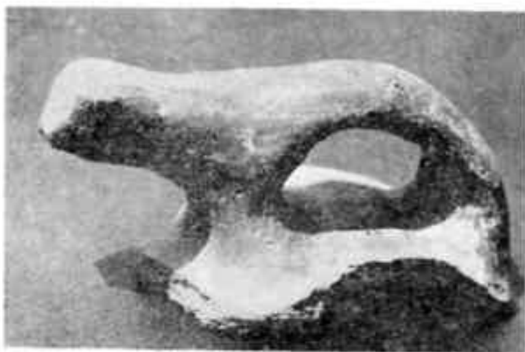
Сосуд с изображением фигурки животного

Ответ на этот вопрос дали раскопки башен: они овальные, сложены из крупного кирпича и пахсовых блоков, внутри них — глиняная посуда, которой пользовались воины. Посуда, найденная на самых древних полах башни, также относится к первым векам нашей эры. Значит