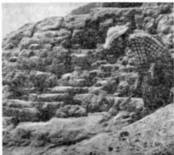
Начинаются раскопки крепостных сооружений

Вскрыты монументальные стены раннефеодальных построек, сеть которых особенно густа в IX—XI столетиях, дома из жженого кирпича, водопроводы, хаузы. В IX—X столетиях этот город был торговым и культурным центром, в котором пересекались караванные пути