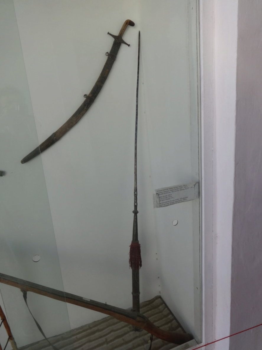
Resim 6: Uzun yapılı bir mızrak (XIX. asır). Buhara Arkı Müzesi, Buhara.