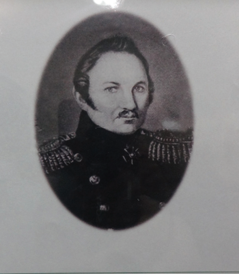
N. V. Xanikov (1822-1878) N. V. Khanikov (1822-1878)

Resim 29: N. V. Hanikov. Buhara Arki Müzesi, Buhara.