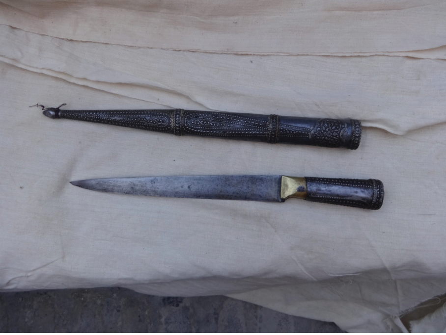
Resim 5: Demir saplı bir haer (XIX. asır). Buhara Arki Mzesi, Buhara.