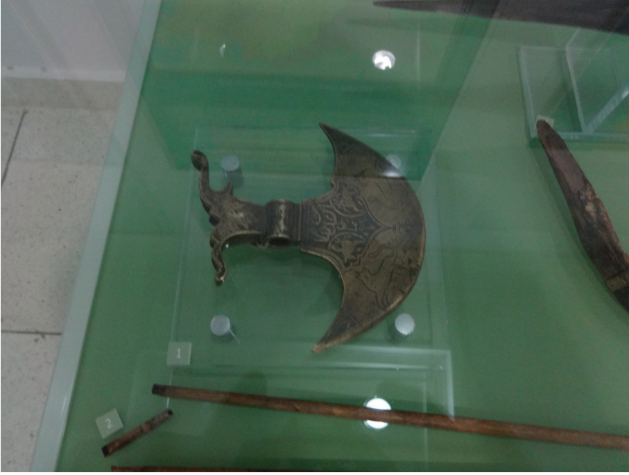
Resim 10: Ay balta (XVIII. asır). Özbekistan Cumhuriyeti Silahlı Kuvvetleri Müzesi, Taşkent.