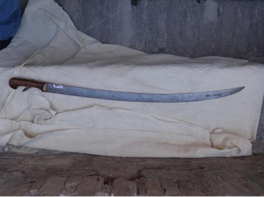
Resim 1: Balçaksız Buhara kılıcı (XIX. asır). Buhara Arki Müzesi, Buhara.