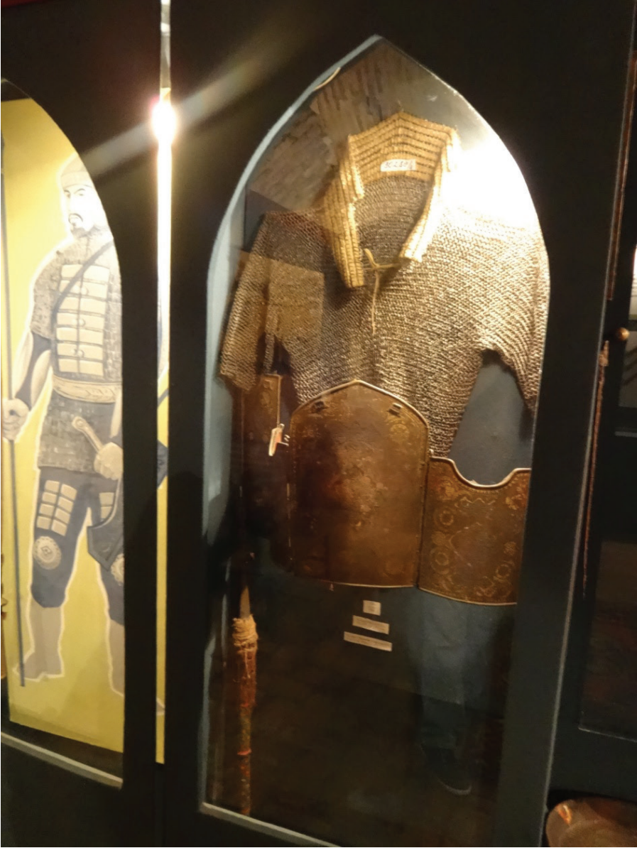
Resim 16: Örgü ve levha zırh (XVI. ve XVII. asırlar). Buhara Demircilik Müzesi ve Atölyesi, Buhara.