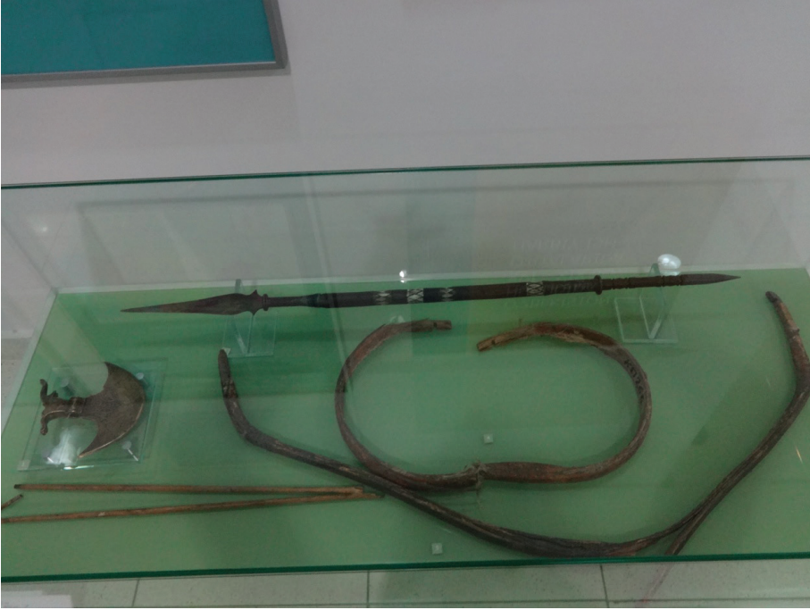
Resim 7: İki uçlu kısa bir mızrak (XIX. asır) ve Buhara yayları (XVIII. asır). Özbekistan Cumhuriyeti Silahlı Kuvvetleri Müzesi, Taşkent.