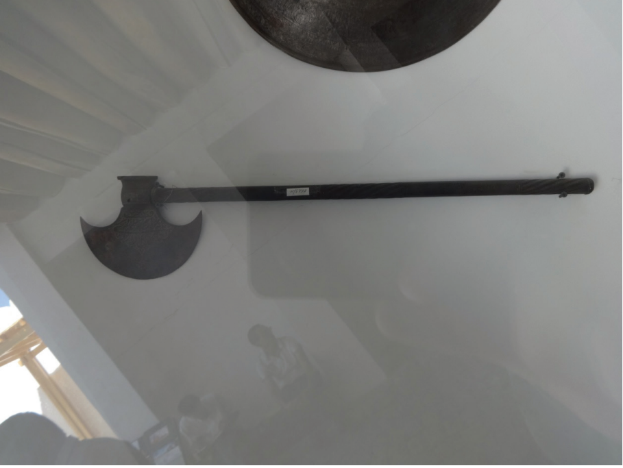
Resim 11: Ay balta (XIX. asır). Buhara Arki Müzesi, Buhara.