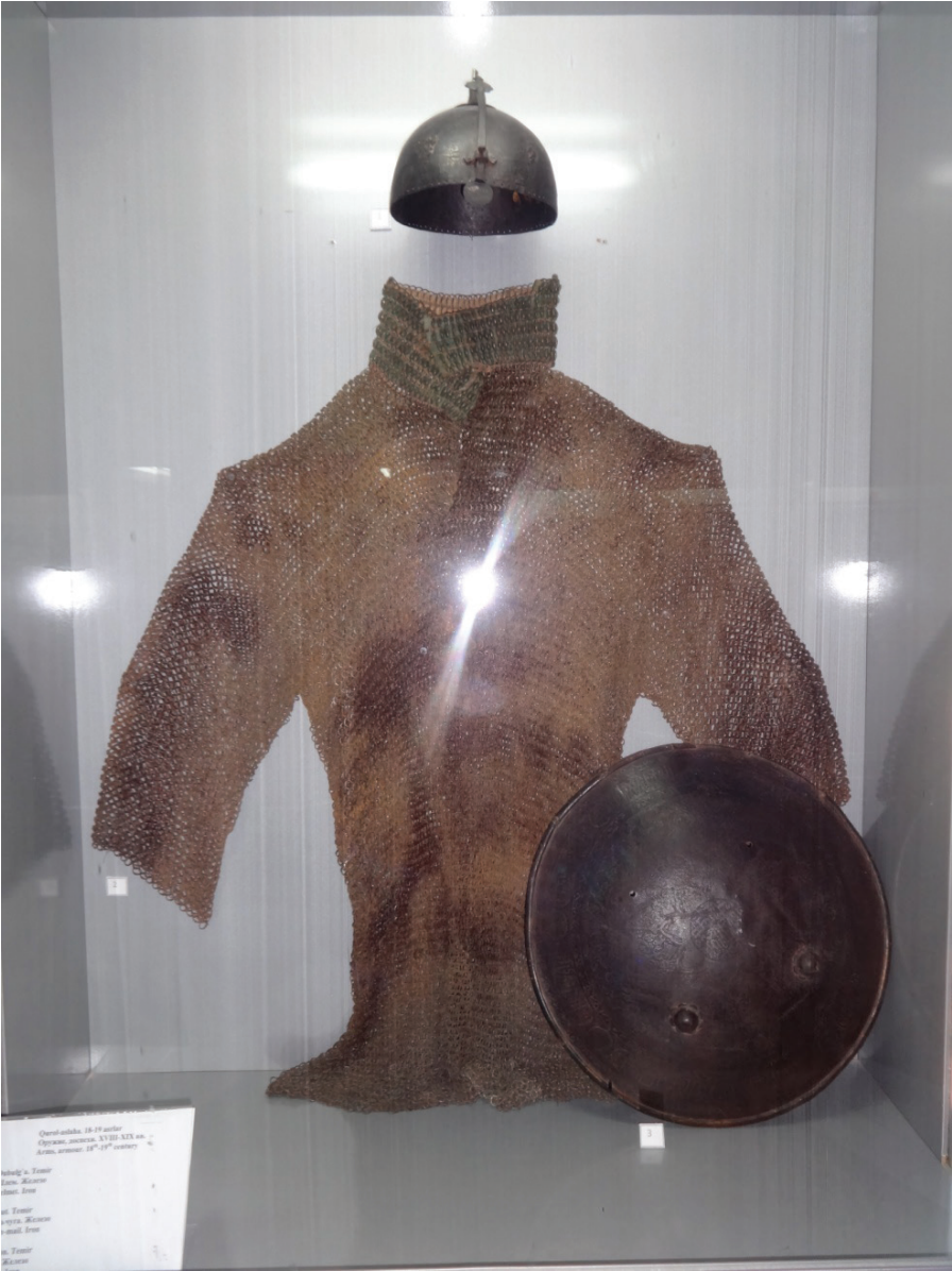
Resim 17: Örgü zırh, miğfer ve kalkan (XVIII. ve XIX. asırlar). Buhara Arkı Müzesi, Buhara.