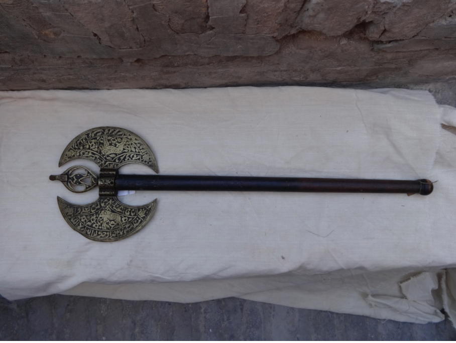
Resim 9: Çift yüzlü tören baltası (XIX. asır). Buhara Arki Müzesi, Buhara.