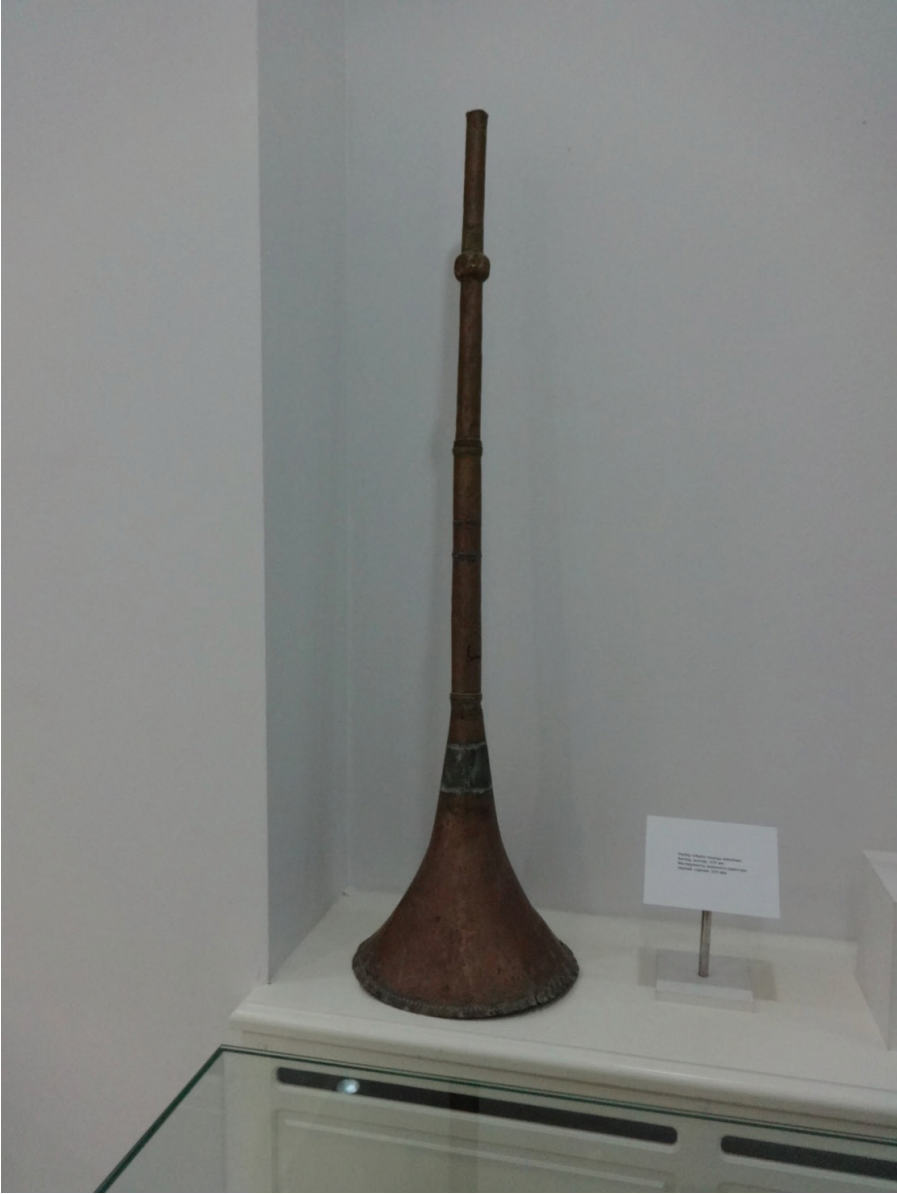
Resim 20: Karnay (XIX. asır). Özbekistan Cumhuriyeti Silahlı Kuvvetleri Müzesi, Taşkent.