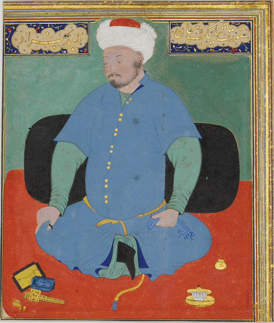
Resim 23: Muhammed Şibani Han'ın Minyatürü (Kemaleddin Bibzâd çizimi). https://en.wikipedia.org/wiki/Muhammad_Shaybani#/media/File:Shaybani.jpg , erişim tarihi: 01.12.2015