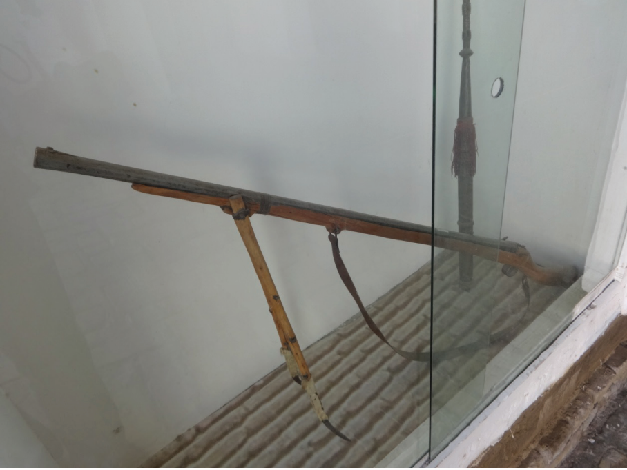
Resim 14: Çatallı/destekli bir miltık (XVIII ve XIX. asırlar). Buhara Arki Müzesi, Buhara.