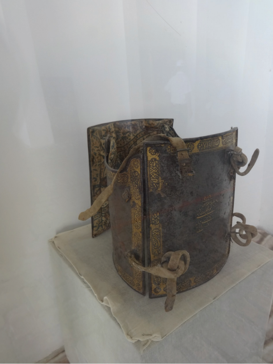
Resim 15: Levha zırh usulünde bir göüslük (çar-ayna) (XVIII. asır). Buhara Arkı Müzesi, Buhara.