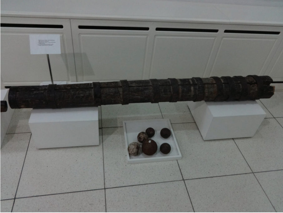
Resim 12: Ağaç top/zenburek ve g lleleri (XIX. asır).  zbekistan Cumhuriyeti Silahlı Kuvvetleri M zesi, Taşkent.