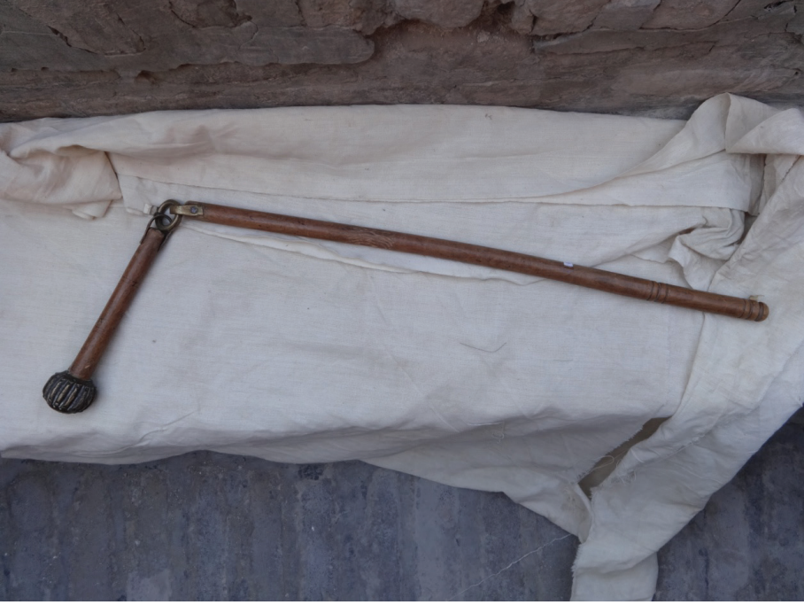
Resim 8: Yıvli bir gürz (XIX. asır). Buhara Arki Müzesi, Buhara.