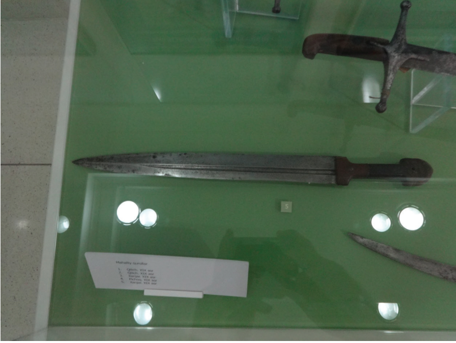
Resim 3: Büyük yapılı bir hançer (XIX. asır). Özbekistan Cumhuriyeti Silahlı Kuvvetleri Müzesi, Taşkent.