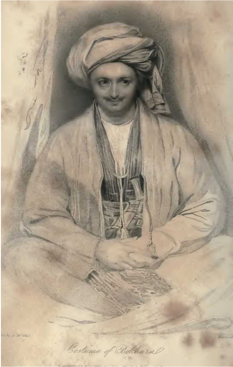
Resim 27: Aleksander Burnes, (Buhara geleneksel kıyafetleri ile). A. Burnes, Travels into Bokhara; being the Account of A Journey from India to Cabool, Tartary and Persia, C.II., London, 1834.