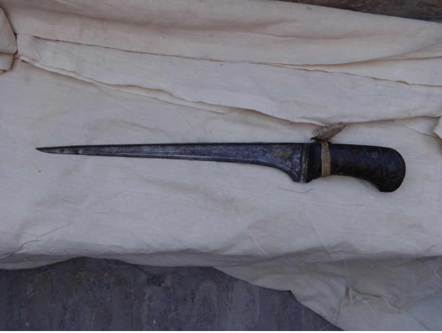
Resim 4: Büyük yapılı bir hançer (XIX. asır). Buhara Arki Müzesi, Buhara.