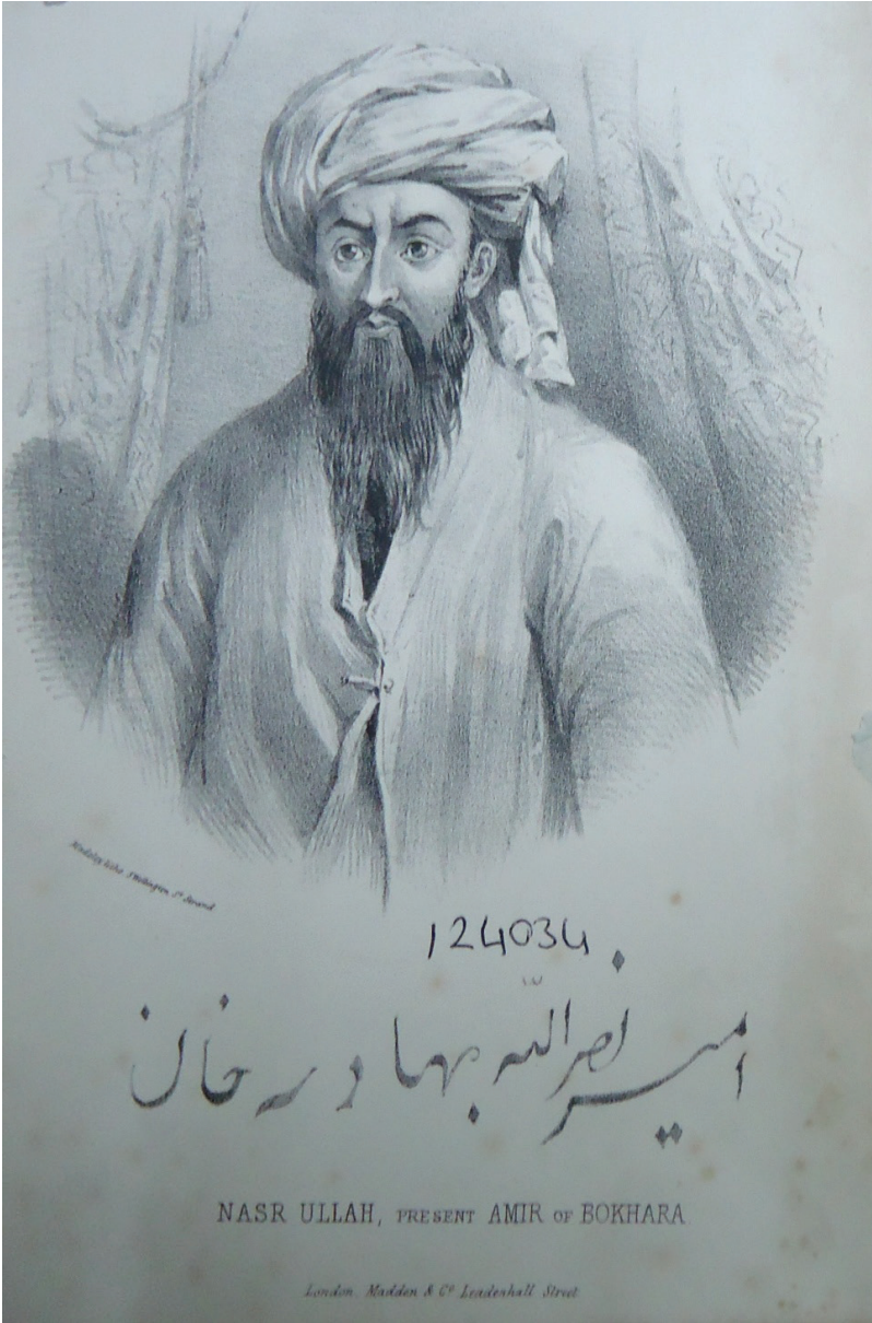
Resim 25: Emir Nasrullah'ın temsili portresi.