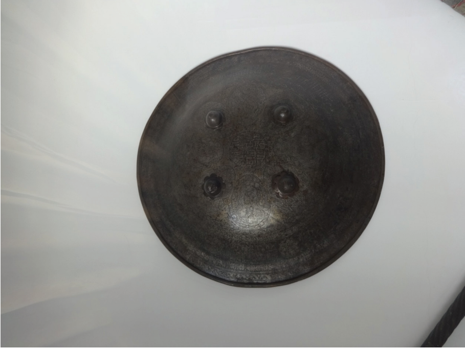
Resim 18: Kalkan (XIX. asır). Buhara Arki Müzesi, Buhara.