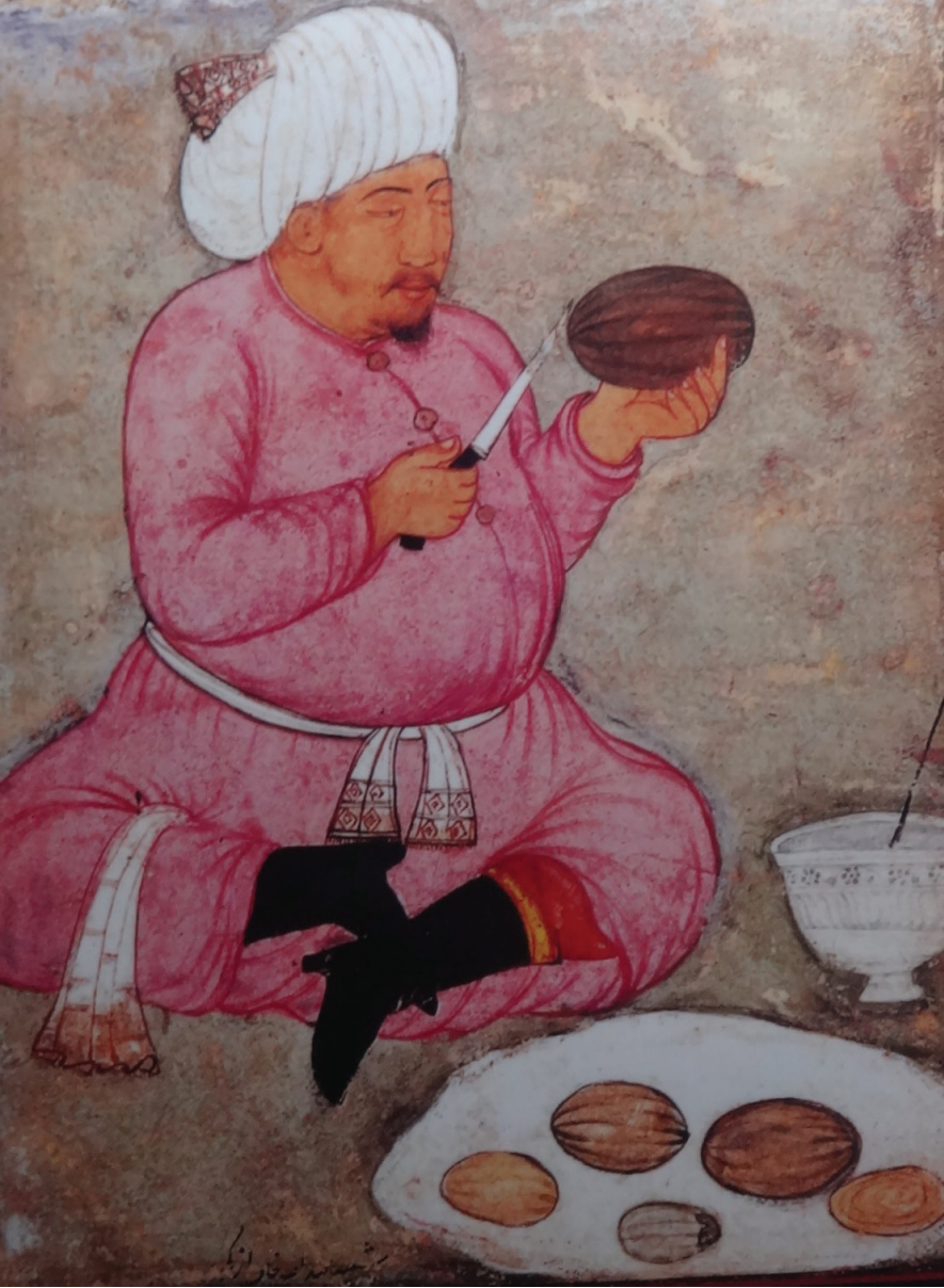
Resim 24: Abdullah Han'ın Minyatürü. Buhara Arki Müzesi, Buhara.