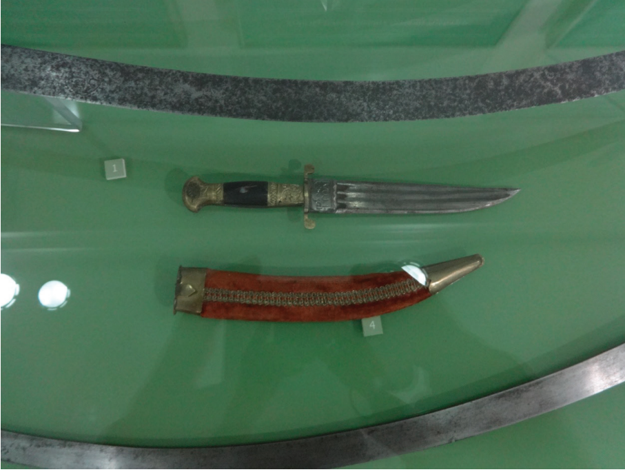
Resim 2: Küçük yapılı bir hançer (XVIII. asır). Özbekistan Cumhuriyeti Silahlı Kuvvetleri Müzesi, Taşkent.