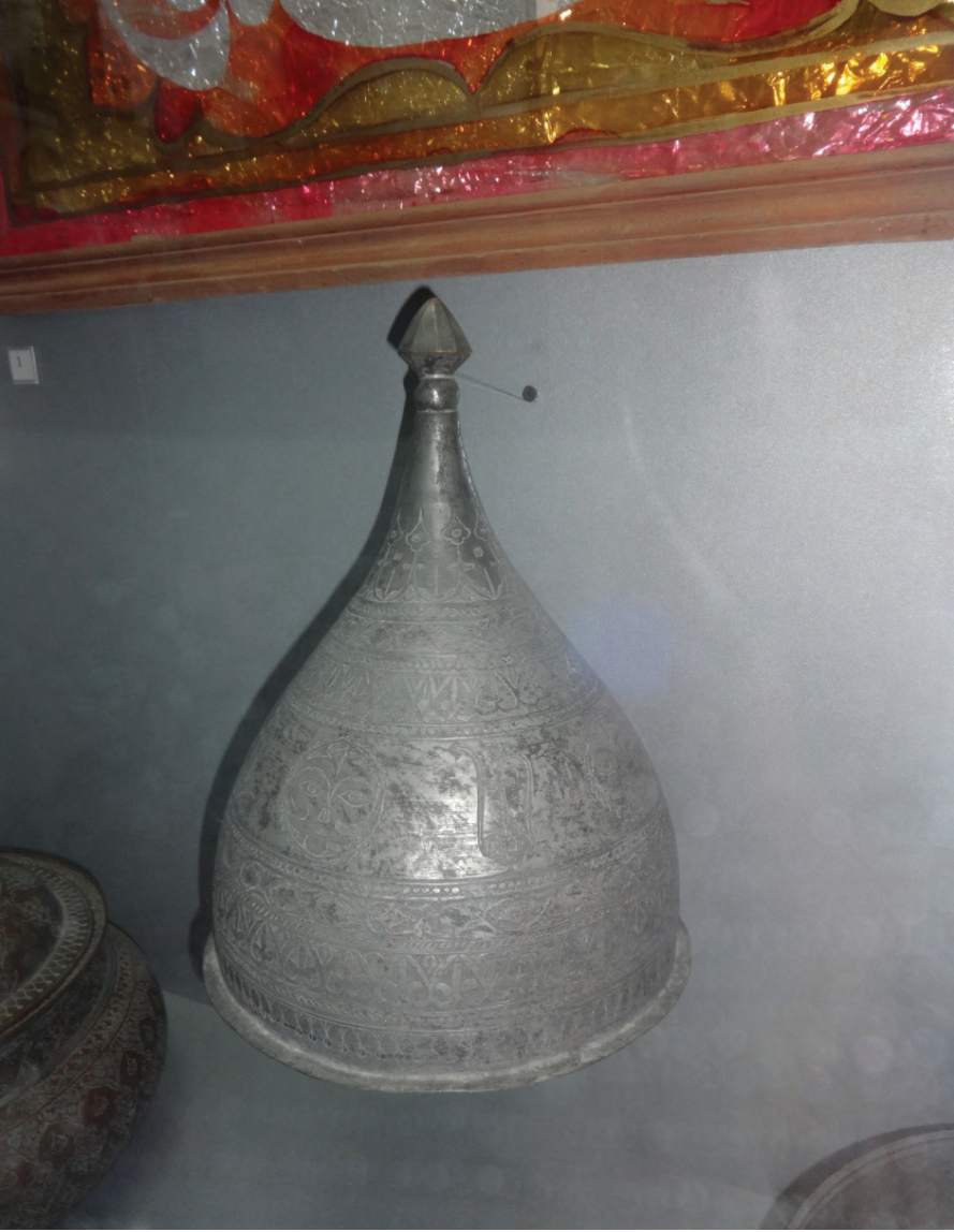
Resim 19: İnan'dan ithal edilen bir miğfer (XVIII. ve XIX. asırlar) Buhara Arkı Müzesi, Buhara.