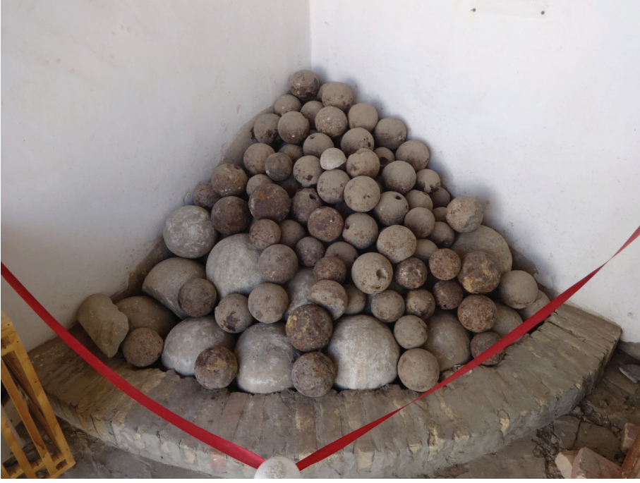
Resim 13: Muhtelif ağır ve hafif topların taş ve madeni gülleleri. Buhara Arkı Müzesi, Buhara.