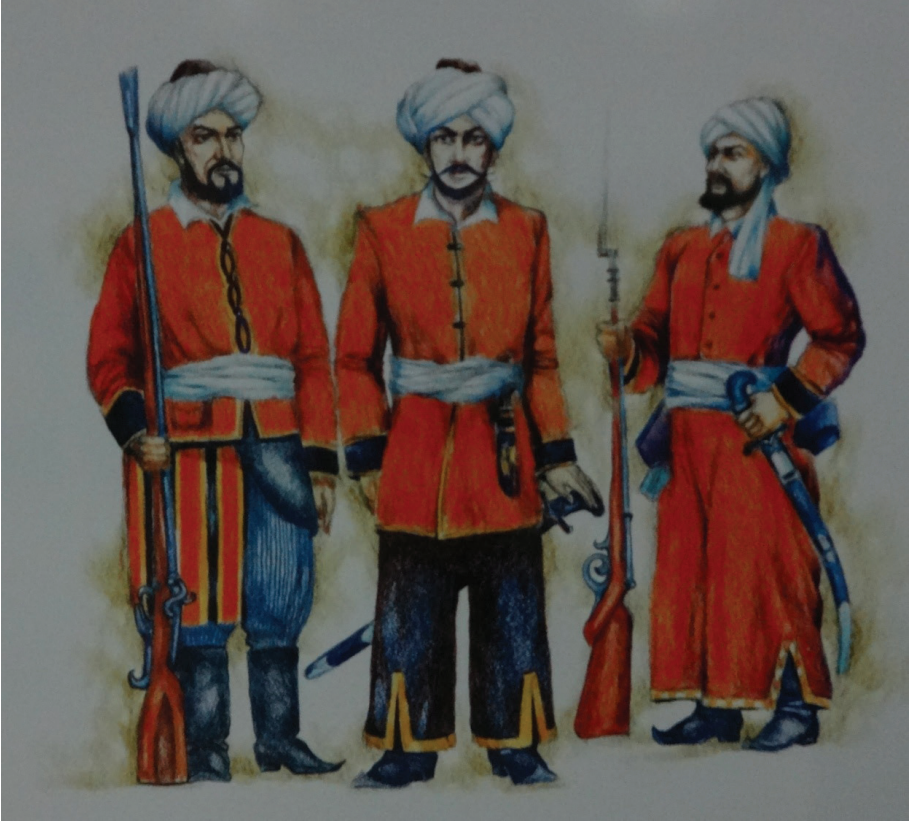
Resim 21: Serbazi Askerleri (XIX. asrın ilk yarısı). Özbekistan Cumhuriyeti Silahlı Kuvvetleri Müzesi, Taşkent.