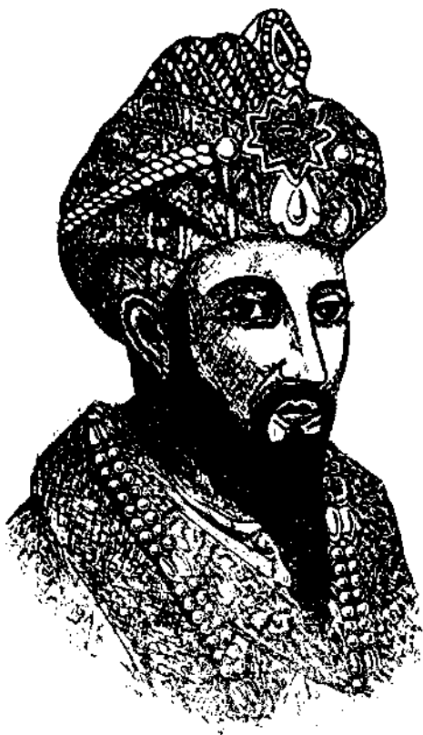
Амӣр Темурнинг бу суврати Н.Мордониини Ҳиндистон тарихи китобидан олинди