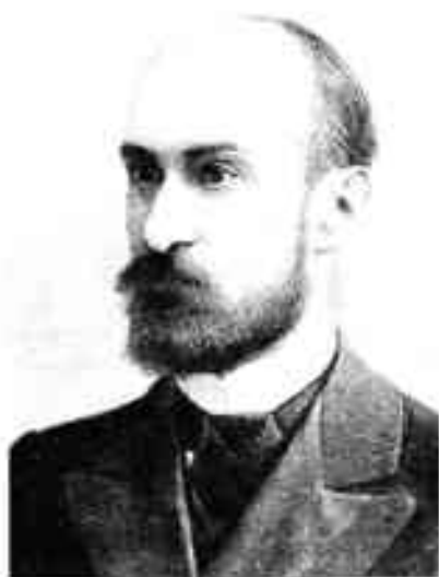
Василий Владимирович Бартольд (1869—1930 гг.)