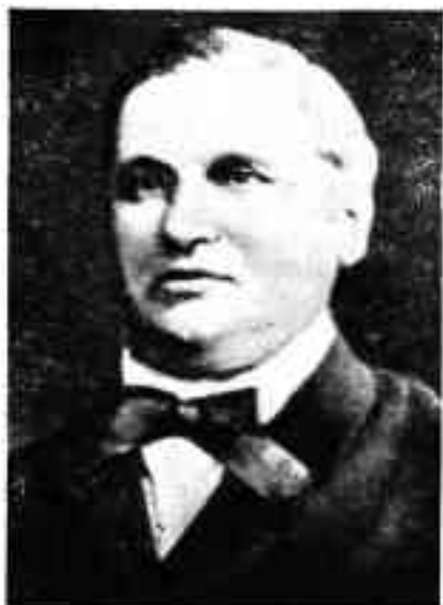
Василий Васильевич Григорьев (1816 — 1881 гг.)

Одним из ярчайших представителей этого, в значительной мере нового (и во всяком случае существенно отличавшегося от прежнего) направления и суждено было явиться В. В. Бартольд.