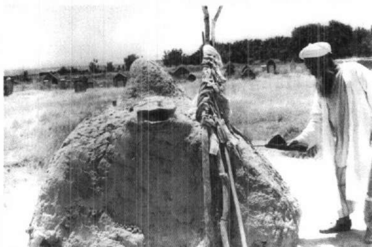
Хожа Самандар Термизий қабрининг мустақилликдан олдинги кўриниши.