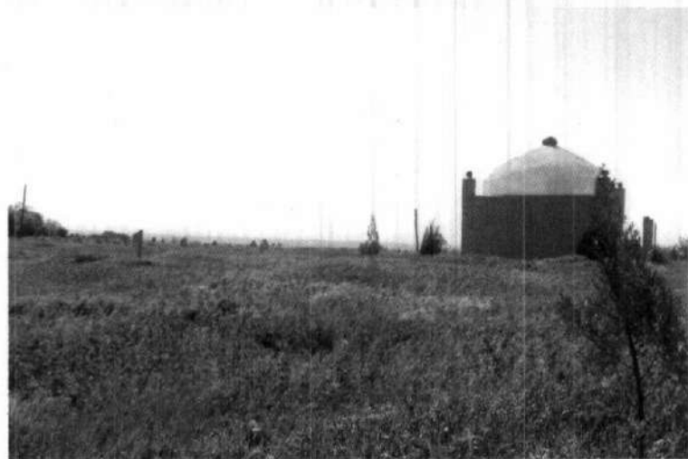
«Хожа Самандар Термизий» қабристони.