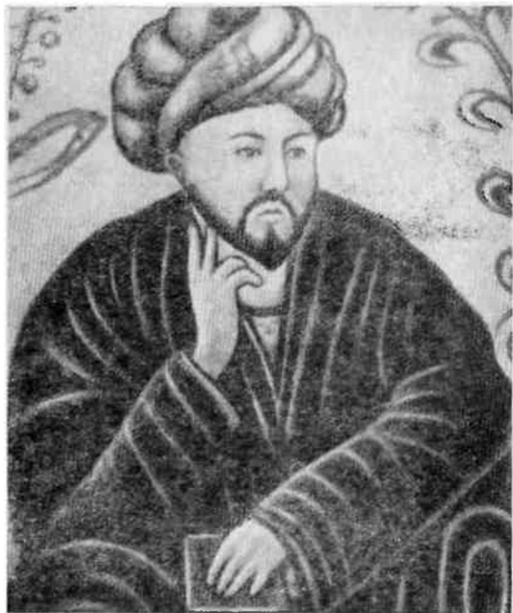
Абу Наср Фараби