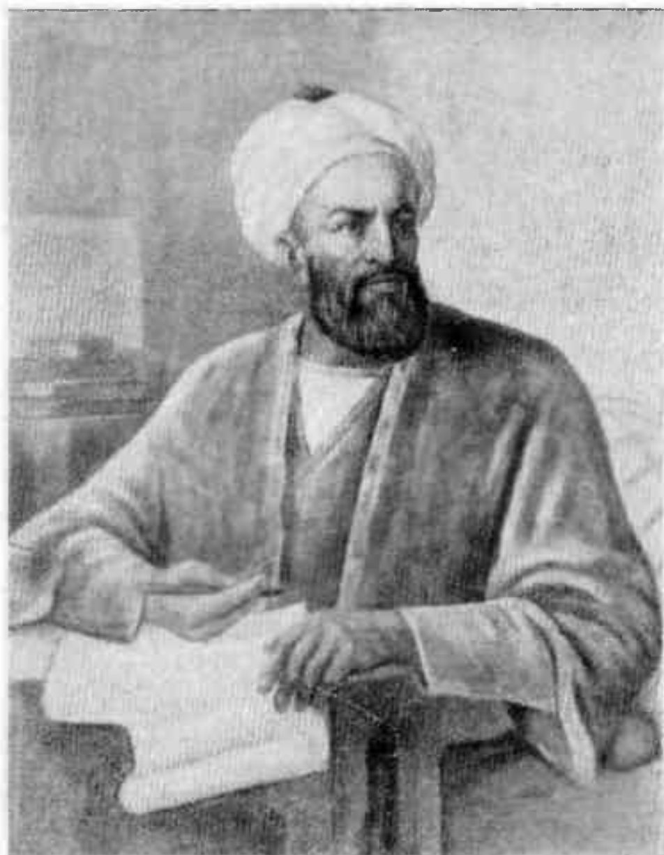
Абу Райхан Беруни