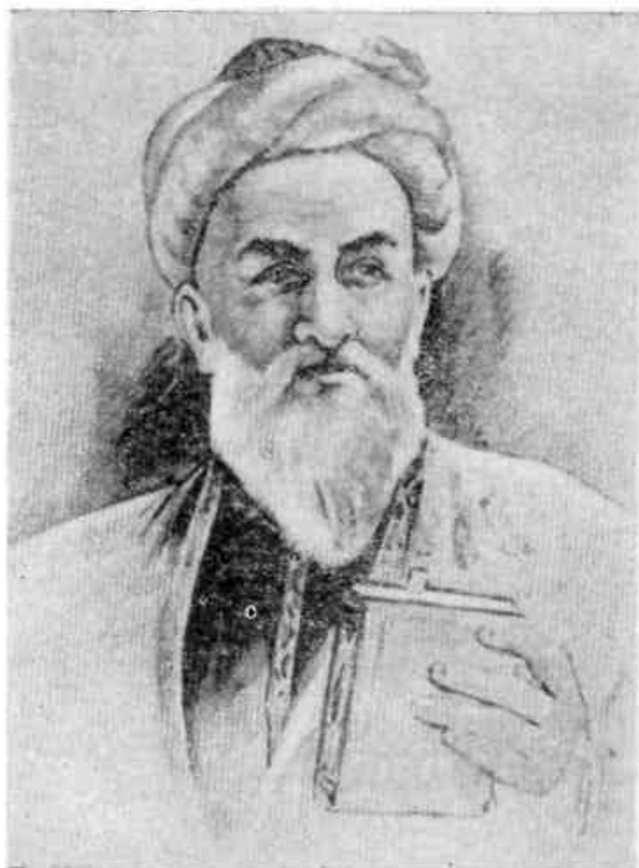
Абу 'Али Ибн Сина