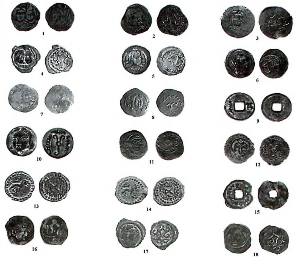
1-расм. Ғарбий Турк хоқонлиги билан боғлиқ “жабғу” (1), “хоқон” (Чоч: 2–4; Фарғона: 7–9; Самарканд: 10–12; Ўтрор: 13–15; Тўхористон: 17) ва “тегин” унвонли (5–6) тангалар

Key words: Early Middle Ages, Ferghana, Turkic Qaghanate, Ashina dynasty, coins, writing sources.