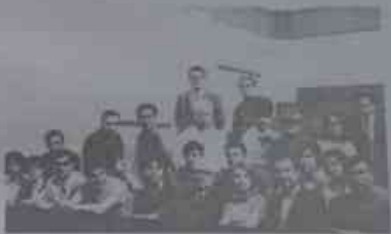
33-расм. § 337.

1964-1968 йилларда меннинг раҳбарлигимда диссертация химоя қилган шогирдларим: 1. Маньжуриялик Тан-чи. 2. Ойдинлик Тунжер Байқоро (Туркия) 3. Покистонлик Асро-ридин Аҳмад. 4. Анвар Қуникчи (Туркия). 5. Хуан Чи-хезул (Хитой). 6. Э.В.Тугон (Истанбул 1968 й.).