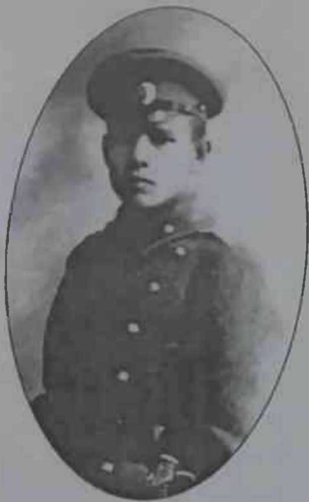
10-расм. § 156.

Қолганлари ҳарбий хизматчилар ва ҳукумат аъзолари.