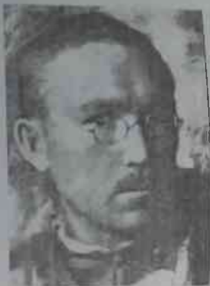
12-рaсм. § 163. А.З. Валидов ҳарбий кийимда (1919-1920 й.)