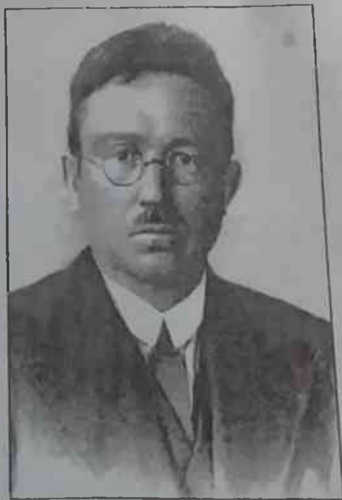
11-расм. § 156.

Бошқирдистон ҳукумати раиси А.З. Валидов. 25-феврал 1920 йил, Истарлитамоқ.