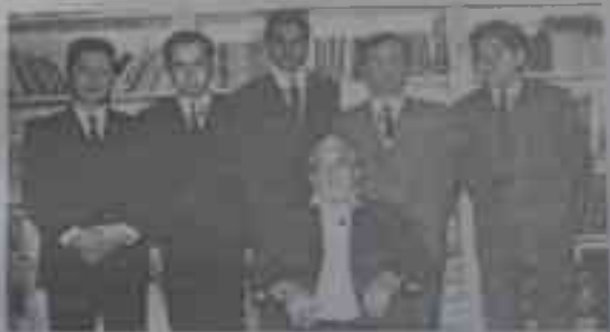
32-расм. § 337.

1964-1968 йилларда меннинг раҳбарлигимда диссертация химоя қилган шогирдларим: 1. Маньжуриялик Тан-чи. 2. Ойдинлик Тунжер Байқоро (Туркия) 3. Покистонлик Асро-ридин Аҳмад. 4. Анвар Қуникчи (Туркия). 5. Хуан Чи-хезул (Хитой). 6. Э.В.Тугон (Истанбул 1968 й.).