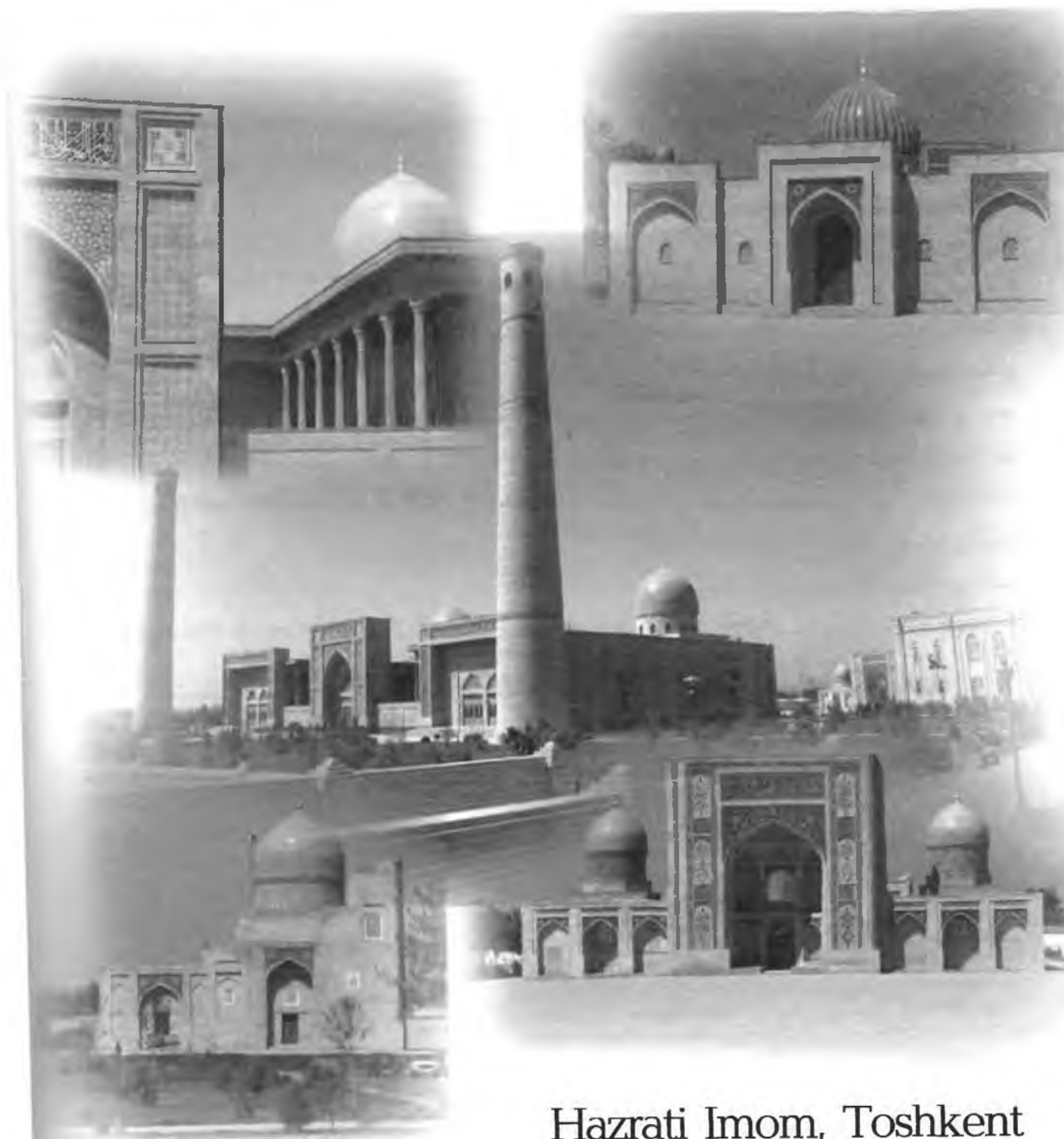
Hazrati Imom, Toshkent