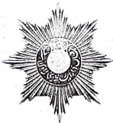
Рис. 1. Орден Благородной Бухары (ФН МИА, инв. № 3131). Аверс

В богатой коллекции фонда фалеристики и глиптики Национального музея истории Азербайджана (НМИА) особое место занимает орден Благородной Бухары (инв. № 3131) (рис. 1, 2) (такой же экземпляр находится на сохранении в фондах Эрмитажа). Орден изготовлен из серебра, имеет общий вес 52.2 г при диаметре 9 см. Представляет собой звезду с удлинёнными восходящими восьмиконечными лучами, каждый из которых составлен из расходящихся лучей. На аверсе ордена в центре звезды укреплен медальон диаметром 3.5 см. На плоском бирюзовом эмалевом фоне медальона располагается полумесяц рогами вверх, внутри которого – восточный орнамент, похожий на корону. Вокруг него серебром по синей эмали велась надпись на арабском языке «Ситорои Бухорои Шариф» («Звезда Благородной Бухары») и дата «1303» (дата учреждения ордена эмиром Абдалахадом). 1303 год по хиджре соответствует 1885 г. по григорианскому летосчислению.