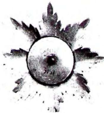
Рис. 2. Орден Благородной Бухары (ФН МИА, инв. № 3131). Реверс