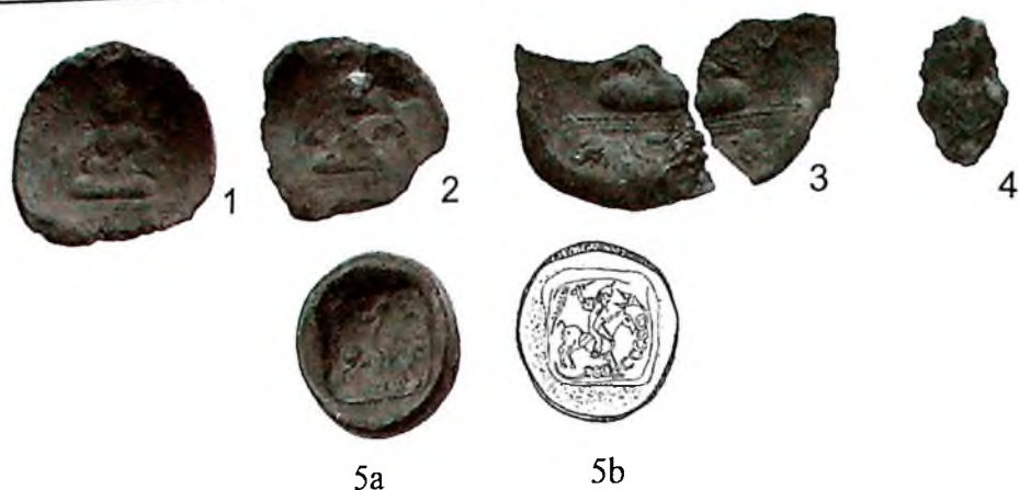
3-расм. VII–VIII асрларга тегишли эски туркча “хотун” (Кофир-қалъа / Самарқанд, 1-4) ва “хокон” (Панжикент 5а-б) унвонли муҳрлар