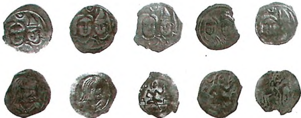
а) Чочда зарб этилган Фарбий Турк хоқонлиги тангалари