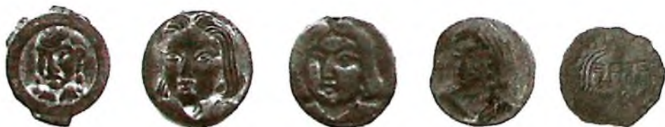
д) Суғд (Самарқанд, Панч) ҳукмдорликларининг туркий суло- лаларига оид тангалар (VI аср иккинчи ярми – VII аср.)