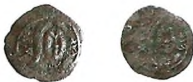
с) Ашина сулоласининг Фарғона тармоғи (630-750) тангалари