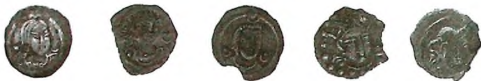
б) Чоч Тегинлари (605-750) ва Чоч Тудунлари (640-750) суло- лалари тангалари