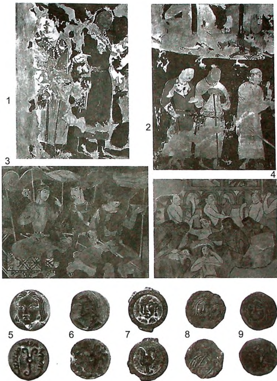
2-расм. Эски турк бошқарувчилари тасвирлари: Афросиёб (Самарканд, 1-2) ва Панжикент (3-4) деворий расмлари; “хоқон”, “хотун” унвонли Суғд (5-8) ва Чоч (9) тангалари (VI–VIII асрлар)