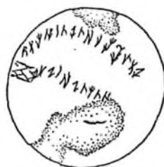
1-расм. Иссиқ қўрғонидан топилган кумушдан ясалган идишга ёзилган ёзув.

дан фарқ қилади. Шу билан бирга Иссиқ қўрғони қабрларидан бирида кумушдан ясалган идиш топилган бўлиб, унинг қуйи томонида ёзув бўлган (1-расм.) Қўрғондан топилган ёзув Иссиқ қўрғони каби ёдгорликларни қолдирган сакларнинг жамияти, турмушига ўхшайди 23 . Бу ёдгорликни ўрганган олимларнинг фикрига кўра ёзув милоддан аввалги II асрнинг 40-йилларига оид бўлиб, Амударё бўйларига юэчжи қабилаларининг сиқуви остида сакаравакларнинг келгани ва чап қирғоқдаги Ойхоним ўрнидаги юнонлар қурган шаҳарни вайрон қилганликлари ҳамда бу ёзувни айнан руник ёзувлари эканлиги тўғрисида ёзишди. Улар ўзларининг фикрини саклар қолдирган ёзувдан ташқари юнон ёзувида ҳам ёзилган кўплаб ёзувларнинг борлиги билан тасдиқлашди (2-расм).