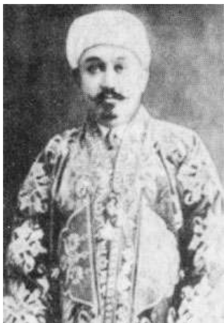
Генерал Ҳожи Юсуфбек

қилиб, ўз ишидан бизни огоҳлантириб турарди. Шунда бу бандайи ожиз ислом йўлидаги мужоҳидлар учун юқори мансаблар, даража ва шонларини кўтариш учун муҳрим ва имзом билан буйруқ юборардим. Ҳар гал ҳол сўраш учун ўз тарафимдан Қобул доруссалтанасидан бир — икки нафар одам юбориб холидан хабар олардим. Шундай қилардимки, менинг тарафимдан борганлар ҳол-аҳвол сўрашиб, қайтиб келишарди; Иброҳимбек ҳам ўз ишини ҳеч маҳал менинг ижозатимсиз қилмасди. Шу аснода Иброҳимбек Ҳисор вилоятини ўраб олган бўлади. Бухоройи шариф тарафидан турк Анвар пошшо 23 йигирма етти нафар турклар билан Бухоронинг шарқ тарафидан Қўрғонтепа вилоятида мужоҳид аскарларига яқин келади. Шунда мазкур аскарлар Анвар пошшонинг бу келиши кайфиятини мулло Иброҳимбекка хабар беришибди. Шу билан бу лашкарбошимиз 24 бу маънодаги гапни бу бандага хабар қилади. Аҳволга кўра қандай сиёсат юргизишни у менинг фикр-мулоҳазамга ташлайди. У кайфиятни, доно бир тадбир ишлатиш йўлини ва хусусан мусулмонлар халифаси бўлмиш Султон Рашидхон 25