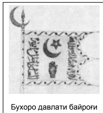
Бухоро давлати байроғи

Бухоро амири қанчадан-қанча минг бош отни Русия давлатига берди. Ҳар хил фаслларда тоғу чаманзорлар ранг-баранг бўлганидан қўй, эчки, от ва туя сурувлари ўз ўтлоқларида