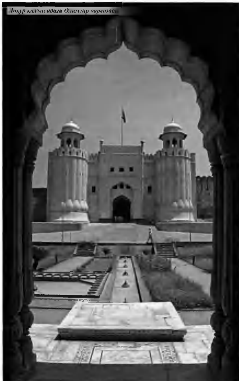
Лоҳур қалъасидаги Олимғир дарвозаси