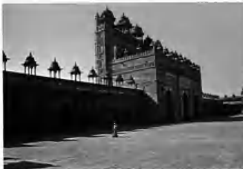
Уттар прадеш Фотеҳпур сикрий шаҳридаги жаме масжидининг «Баланд дарвозаси» кўринишлари