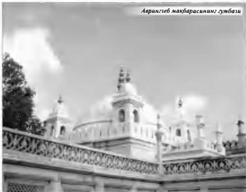
Авраиғзеб мақбарасининг гумбази