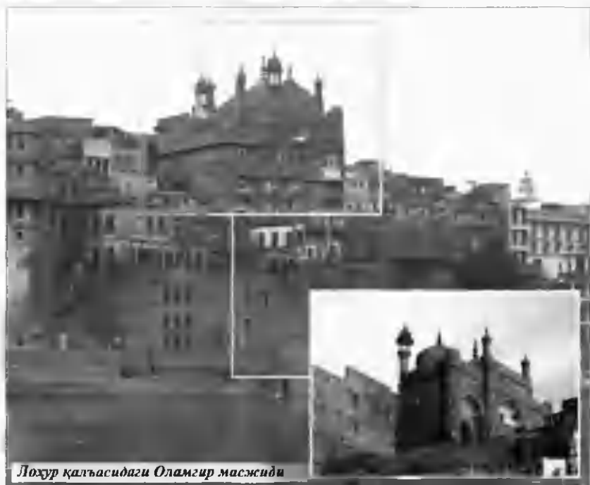
Лохур қалъасидаги Оламгир масжиди