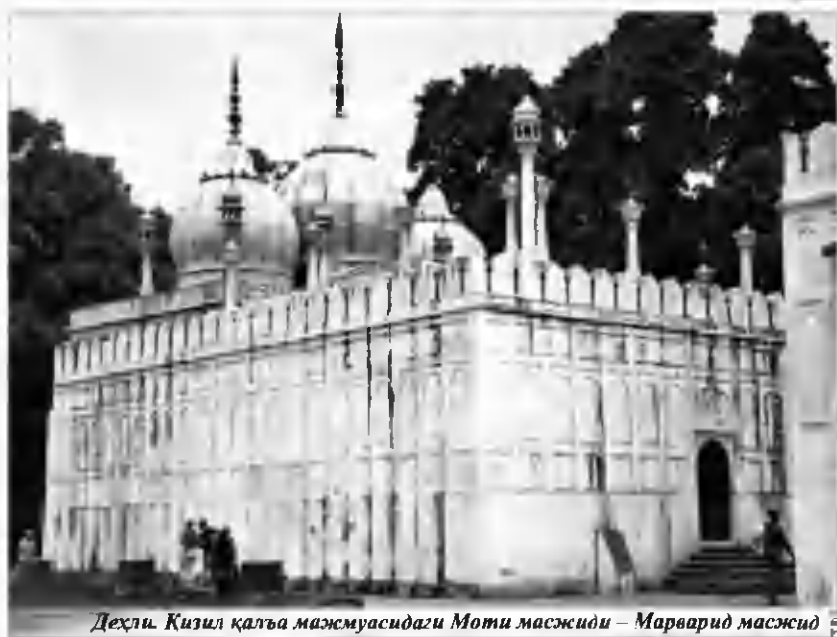
Деҳли. Қизил қалъа мажмуасидаги Моти масжиди – Марварид масжиди