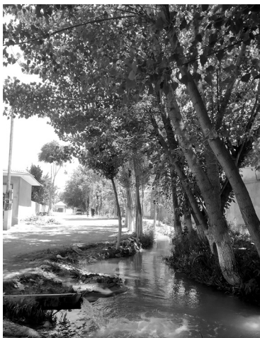
Ариқ. Наманган вилояти Косонсой тумани. 2020 йил.

канал ва ариқлардан шарқираб келадиган сувдан унумли равишда фойдаланилган. Бундай сувлар халқ орасида, одатда, «оқ сув» деб аталган. Айнан «оқ сув»дан тўйимли таомларни тайёрлаш ва ташналикни қондирувчи, дардга даво ичимлик – «оқ чой» дамлашда кенг фойдаланилган.