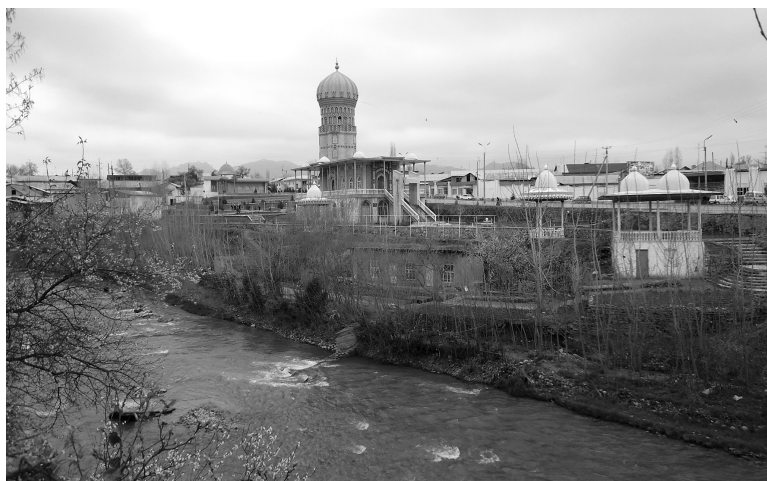
Косонсой. Наманган вилояти Косонсой тумани. 2016 йил.

Косонсой дарёси Чотқол ва Қурама тоғ тизмалари қўшилган ҳудудлардаги 3000 метр баландликда тоғлардаги Чилдиксой ва Чапчамасой ирмоқларидан бошланади. Унинг узунлиги 154 километр бўлиб, умумий ҳавзасининг майдони 1650 км 2 ни ташкил этади. Ҳавзасининг 2/3 қисми майин жинслардан ва 1/3 қисми сурилма қоялардан иборат. Ўртача баландлиги – 2347 метр. Тоғли қисмида водийга шимоли-ғарбдан жануби-шарққа томон, текисликда эса шимолдан жануб (Сирдарё) тарафга оқади. Сув йиғиш ҳавзасида Ишиамберди, Теперек, Олабуқа ва Қорасув каби йириқ ирмоқлари мавжуд. Унинг сув йиғиш ҳавзаси 1650 км 2 , қор ва музликлардан тўйинади. Ўртача кўп йиллик сув сарфи 9,75 м 3 /сек, энг кўп сув сарфи 84,8 м 3 секунд, энг ками эса 1,84 м 3 секунд (март ойида) 1 .