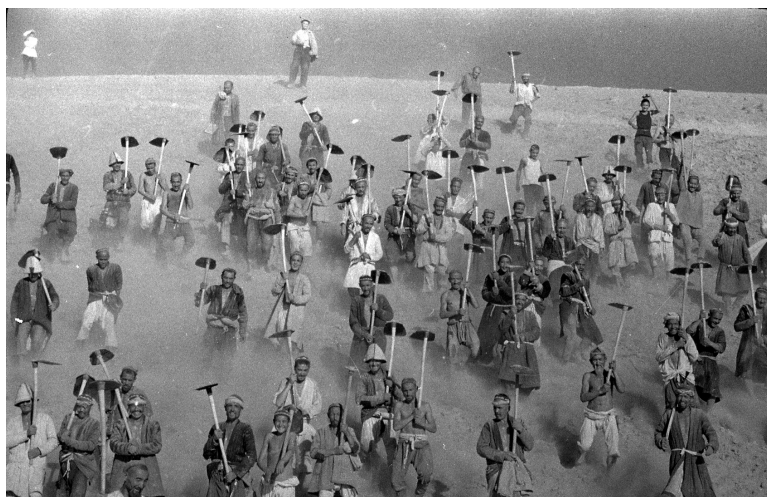
Катта Фарғона канали қурилишига кетаётган меҳнаткашлар.

этилиши натижасида водийнинг суғориш тизими анча такомиллаштирилгани тарихдан маълум.