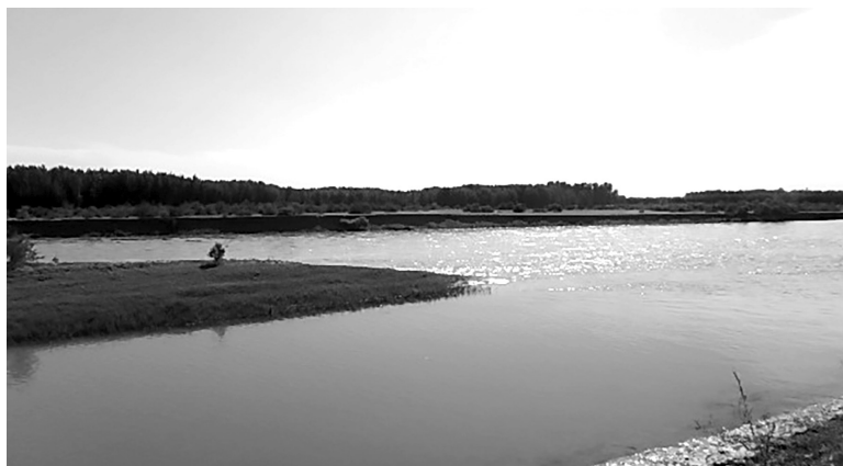
Норин ва Қорадарёнинг қўшилиши ҳамда Сирдарёнинг бошланиши. Норин тумани Наманган вилояти. 2017 йил.

нади ва Ўзбекистоннинг Андижон, Наманган, Фарғона, Тошкент ҳамда Сирдарё вилоятлари орқали Тожикистоннинг Сўғд ва Қозоғистоннинг Туркистон ҳамда Қизилўрда вилоятлари бўйлаб аввал ғарб, жануби-ғарб томон, сўнгра шимоли-ғарб тарафга оқиб бориб, Орол денгизига қуйилади.