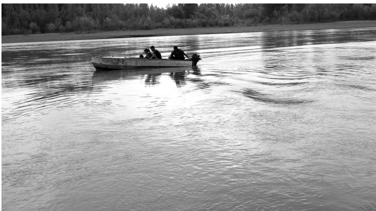
Сирдарёдан сув олиш жараёни. Наманган вилояти Тўрақўрғон тумани. 2018 йил.

турмушнинг иссиқ-совуғи ва паст-баландига бардошли бўлайлик, ҳамма қийинчиликларни мардонавор енгиб ўтайлик, ҳаётимиз ҳам, ўзимиз ҳам шу сувдай тоза, пок бўлайлик, умримиз узун бўлсин деб ният қилинади 1 . Шунингдек, бу жараёнда сув култи (никоҳ сувини ичириш) рудиментлари (қолдиқлари)ни кўришимиз мумкин.