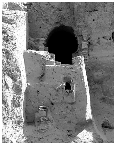
Ахсиқентдаги X–XIII аср бошлариларига оид ер ости сув иншооти. Наманган вилояти Тўрақўрғон тумани. 2018 йил.

Ўрта асрларда яшаб ижод қилган яна бир араб тарихчиси Ат-Табарий Фарғонада 5 та йирик шаҳар – Хўжанд,