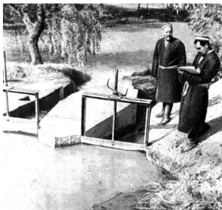
Мироблар иш вақтида

ловчи (мироб) «тузун» сифатида ифодаланган 1 . Одатда, бундай вазифа қишлоқ кекса нурунийси ё оқсоқоли (ҳурматли кишиси) га юклатилган. Мана шу мавзуга тегишли «чатба» (ариқ қозишга, тўғон бўйишга чиқмаганлардан қишлоқ оқсоқоли – тузун оладиган солиқ) атамаси ҳам бор 2 . Шунингдек, турк сайёҳи Э. Ча-