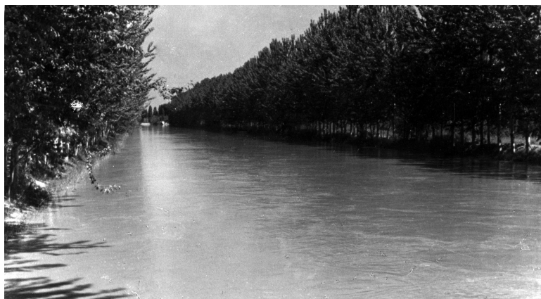
Катта Фарғона канали.

ўтади 1 . Ушбу ҳавза сувларининг катта улуши Норин (45 фоиз) ва Қорадарё (16 фоиз)га, ўнг ва чап қирғоқ ирмоқларига 39 фоизи тўғри келади. Дарё сув оқимининг асосий миқдори (қарийб 70 фоизи) ҳавзанинг юқори қисмида Фарғона водийсидан чиққунча шаклланади. Водийнинг шарқий қисмида Сирдарёга ўнг томондан кўплаб ирмоқлар, чап тарафдан эса бир қатор сойлар келиб қуйилади.