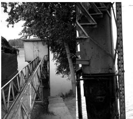
Сирдаёдаги сув ўлчаш станцияси. Наманган вилояти Тўрақўрғон тумани. 2018 йил.

Бу мироблар трансегаравий дарёлар сувини давлатлар ўртасида назорат қилиш ишлари билан шуғулланган.