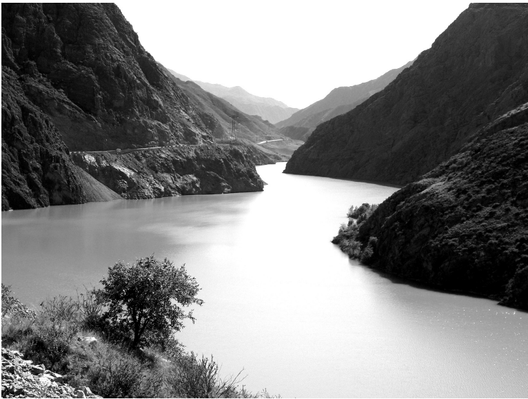
Норин дарёси. Норин вилояти. Қирғизистон Республикаси. 2018 йил.

Фарғона водийсига кираверишда Норин дарёси сувининг ўртача кўп йиллик миқдори 508 \text{ м}^3/\text{сек} ни ташкил этади. «Энг кўп сув сарфи 1969 йилда кузатилган бўлиб, ўртача 709 \text{ м}^3/\text{сек} ни ташкил қилган бўлса, энг кам сувли 1965 йилда ушбу миқдор 351 \text{ м}^3/\text{сек} бўлган, холос. Энг кўп сувли ой июнь, энг кам сувли ой январдир. Норинда энг катта сув 1966 йил 21 июнда кузатилган бўлиб, 2990 \text{ м}^3/\text{секунд} ни ташкил қилган. Баъзи кунларда сув жуда оз бўлиб, 100 \text{ м}^3/\text{секунд} ва ундан озроқни ташкил этиши мумкин» 1 .