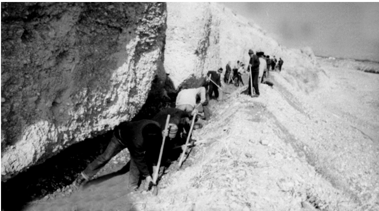
Ҳашар. Наманган вилояти Чуст тумани. 2015 йил.

Ўзбекистоннинг бошқа кўплаб ҳудудларида бўлганидек, Фарғона водийсида ҳам эрта баҳорда далаларга обирахмат суви келадиган асосий ариқ ва каналлар деярли ҳар бир хонадоннинг меҳнатга лаёқатли вакилларининг иштирокида ҳашар усулида лойқадан тозаланган 1 . Маросим учун ҳам пул, буғдой ва озиқ-овқат маҳсулотларини йиғиштириб, тўпланган пулга бирор «жонлиқ» (бузоқ, бўз бия, оқ тойчоқ, қўчқор ёки эчки) сотиб олинган ва у эзгу ният-мақсадда қурбонлик қилинган 2 .