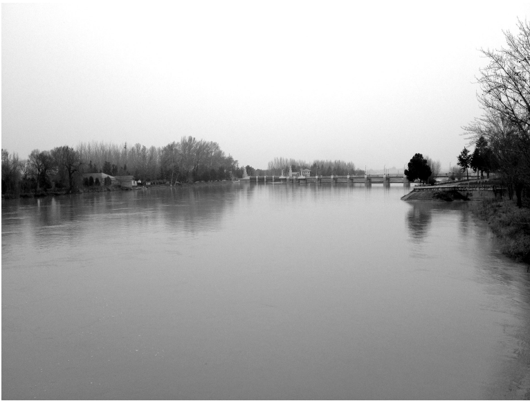
Қорадарё. Андижон вилояти Балиқчи тумани. 2018 йил.

қўшилиши ҳамда ўнг ирмоқларининг ҳисобига оқимини қайта шакллантириб боради 1 .