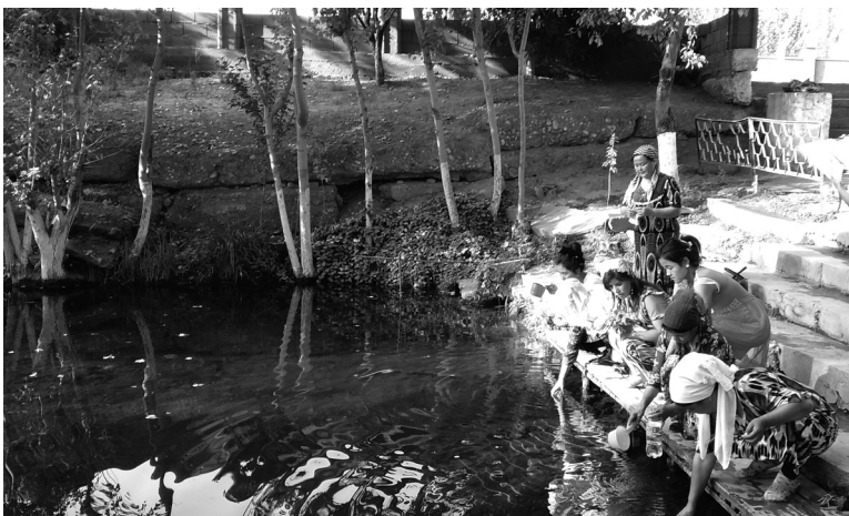
Сутли булоқ зиёратгоҳи. Наманган вилояти Норин тумани. 2018 йил.

Эътиборли жиҳати шундаки, водийдаги жуда кўплаб зиёратгоҳларда албатта булоқ ва чашма бўлиб, улар муқаддаслаштирилган ҳамда маълум бир исломий авлиё, уламо ва машҳур тарихий шахслар номи билан боғланган. Қолаверса, кўплаб зиёратгоҳлардаги булоқлар бўйига ҳанузгача эҳтиёжманд кишиларнинг шифо истаб, фарзанд тилаб келишлари сув култи маълум бир даражада ҳамон мавжудлигини, йўқолиб кетмаганини кўрсатади.