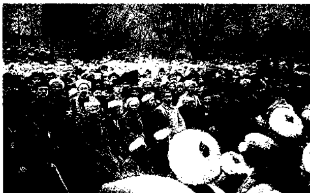
Туркистон мусулмонларининг IV фавқуллода Қурултойида сайланган Туркистон Мухтор республикаси Вақтли ҳукуматининг аъзоларидан бир гуруҳи (олд қаторда)

рийт кенг ҳуқуқ ва имтиёзларга эга бўлган вилоят, уезд ва туманларга бўлиниши назарда тутилмоқда эди.