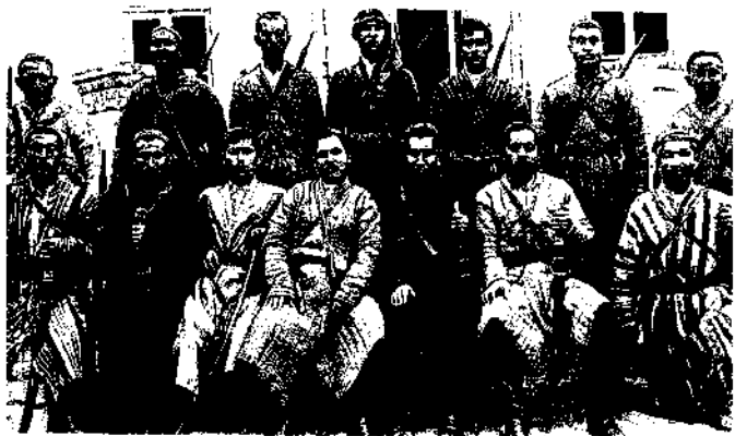
Марғилон миллионясининг фаоллари (1920 йилдаги сурат). Улар большевикларнинг мустақиллик бериш тўғрисидаги ташвиқотиغا ишониб, шўролар томонига ўтган эдилар.