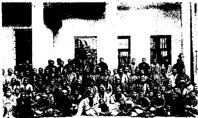
Фаргона истиқлолчилик ҳаракатининг бир гуруҳ йиғитлари. Уларнинг барчаси маҳаллий миллат вакиллари эди