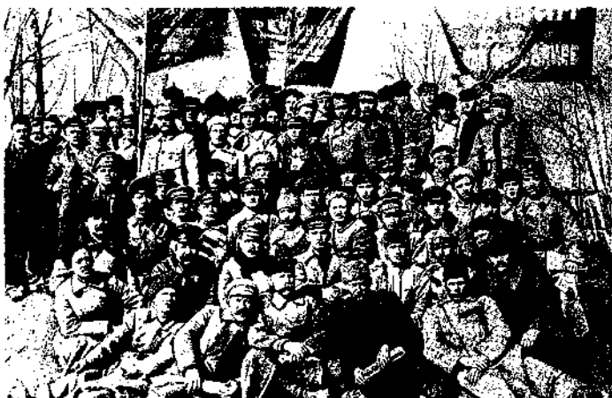
Фаргона frontiда ҳаракат қилган Қизил аскарлар. Уларнинг барчаси рус большевойлари эканига эътибор беринг. Демак, фронтнинг бир томонида босқинчилар, иккинчи томонида ўзбеклар бошлиқ истиқлолчилар турганки, 1918—1923 йилларда Туркистонда бўлган уруш ҳаракатларини асло граждaнлар уруши, деб бўлмайд