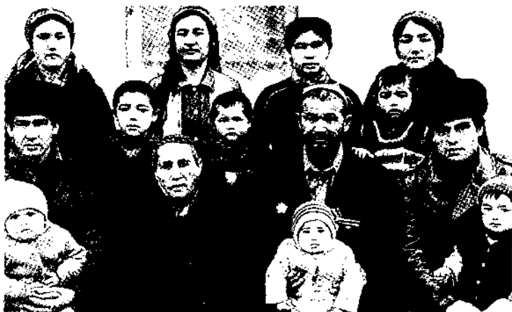
Мадаминбекнинг жияни Одилбек ака жигарлари даврасида

амир ал-муслимин ва бош вазирга улар суиқасд қилдилар.