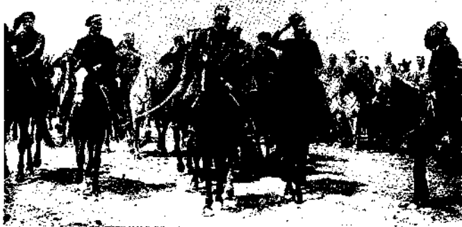
Сулҳ битими имзолангач, Мадаминбек қизиллар ва ўз йиғитлари билан бирга тушган сурат. 1920 йил, март