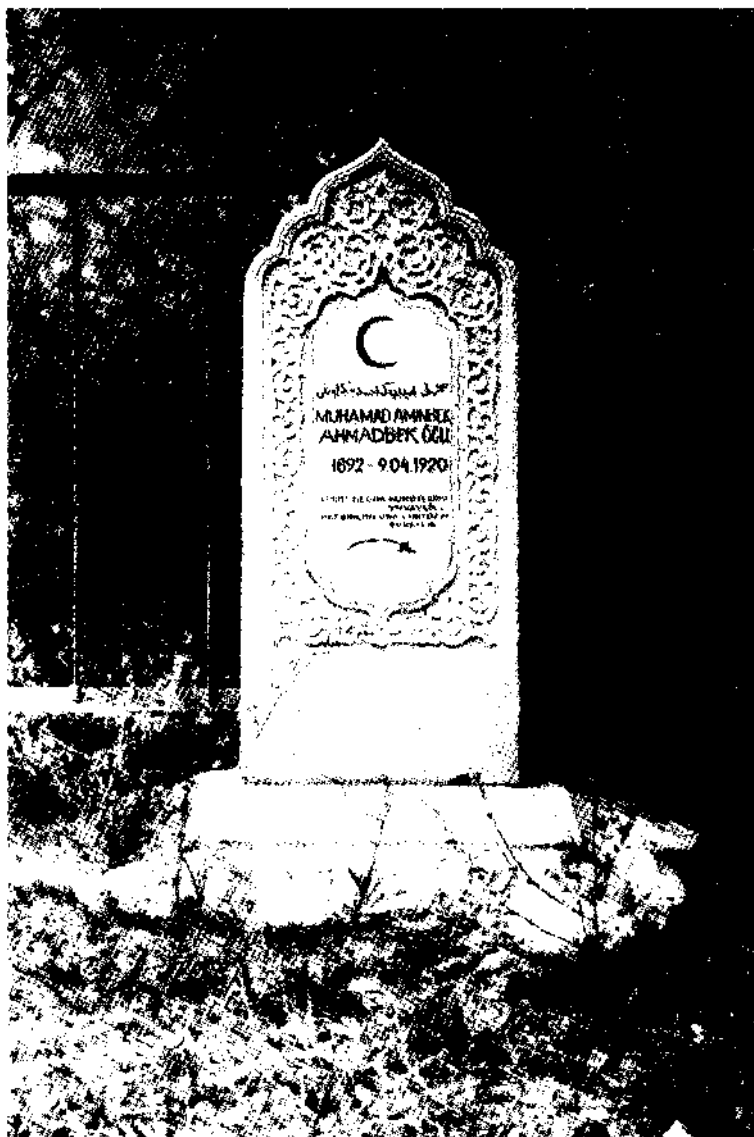
Шигай қишлоғида Мадаминбек қабри устига қўйилган ёдгорлик — мармар тош